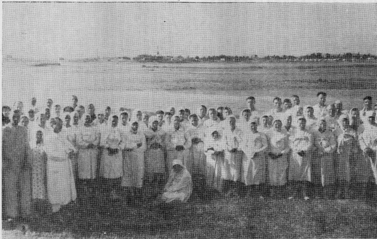
Крещение в Ташкентской общине евангельских христиан-баптистов