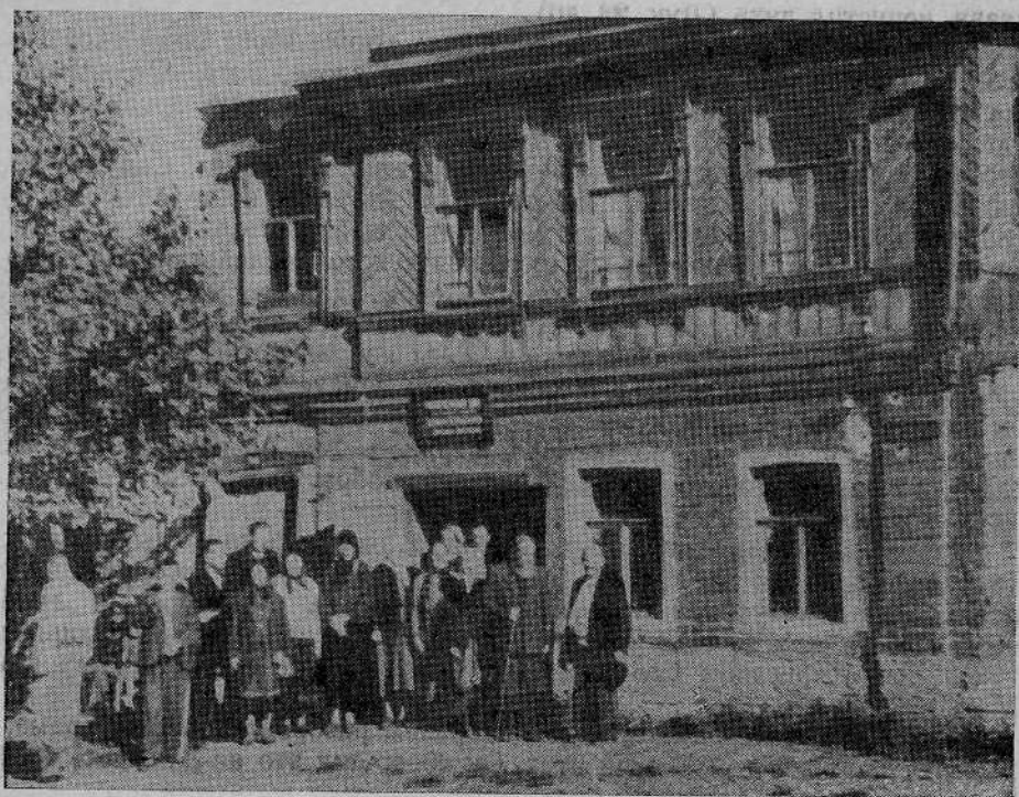
Молитвенный дом Орловской общины евангельских христиан-баптистов (г. Орел)