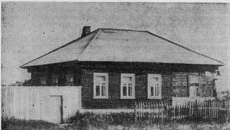
[Молитвенный дом в г. Серпухове, Московской области