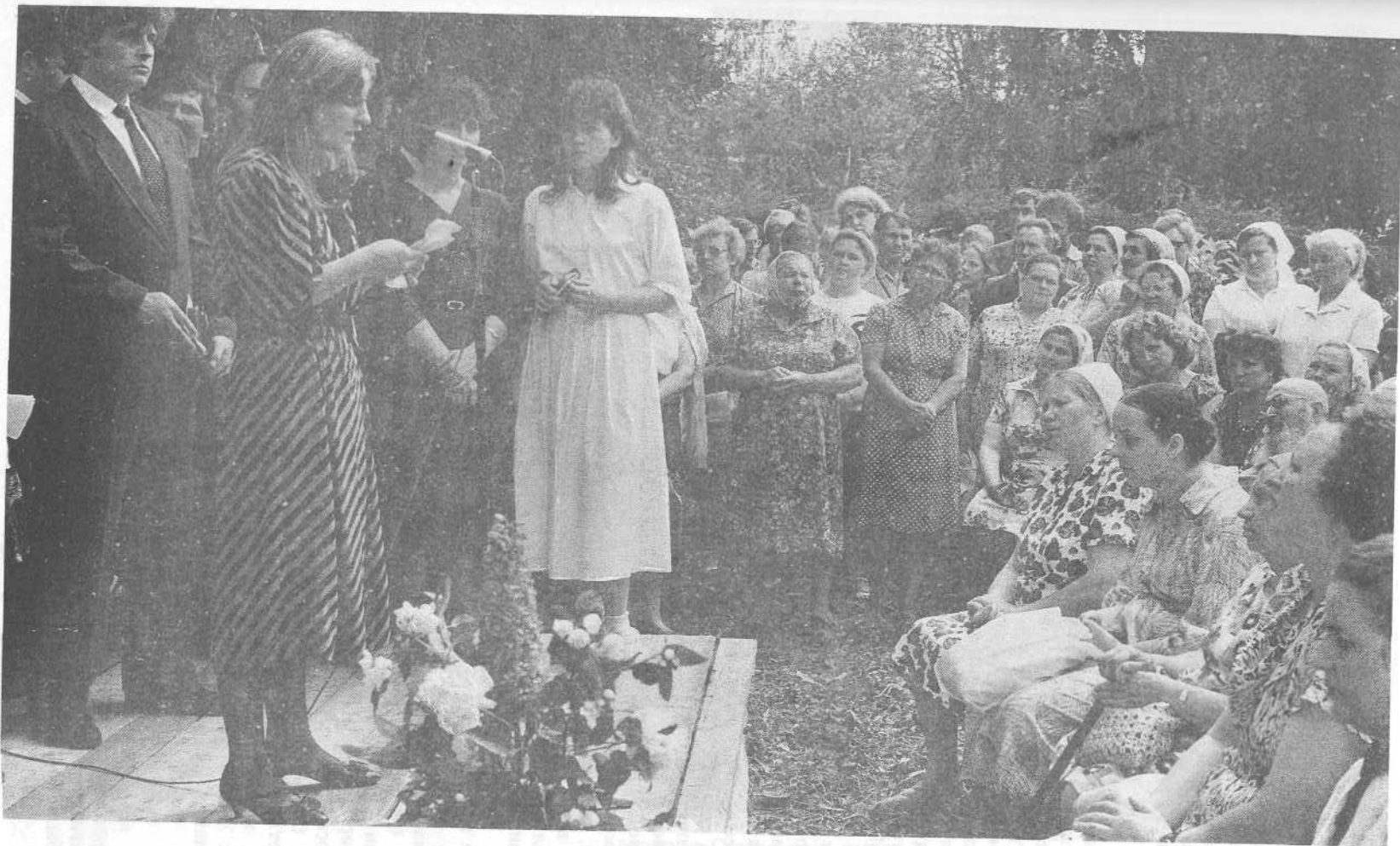
Богослужение Салтыковской церкви, посвященное 1000-летию Крещения Руси.