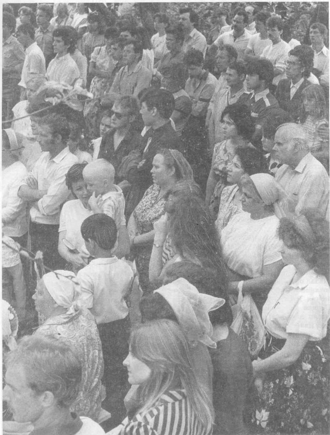
Празднование Салтыковской церковью Тысячелетия крещения Руси.