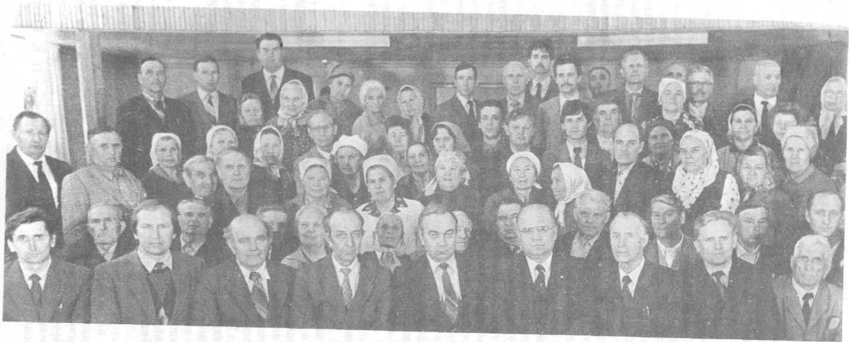
Участники семинара служителей церкви Волгоградской и других областей.