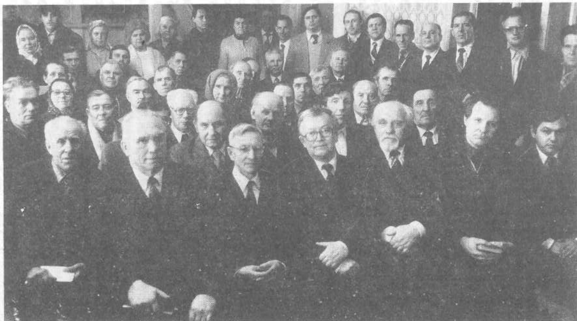
Участники совещания представителей церквей Горьковской и других областей.