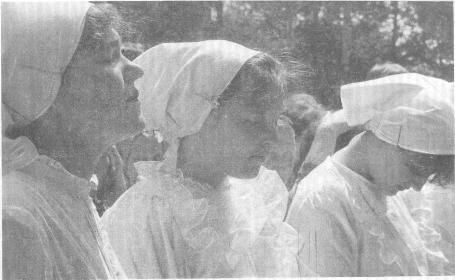
Крещаемые Салтыковской церкви.