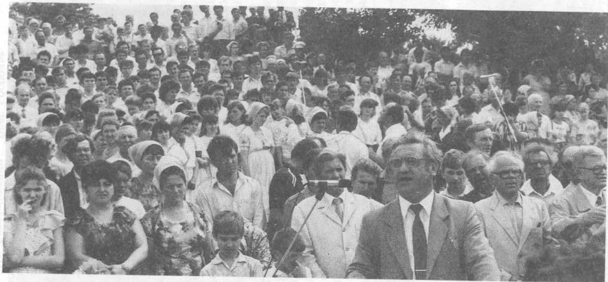
Юбилейное богослужение церкви Любомирка Кировоградской области.