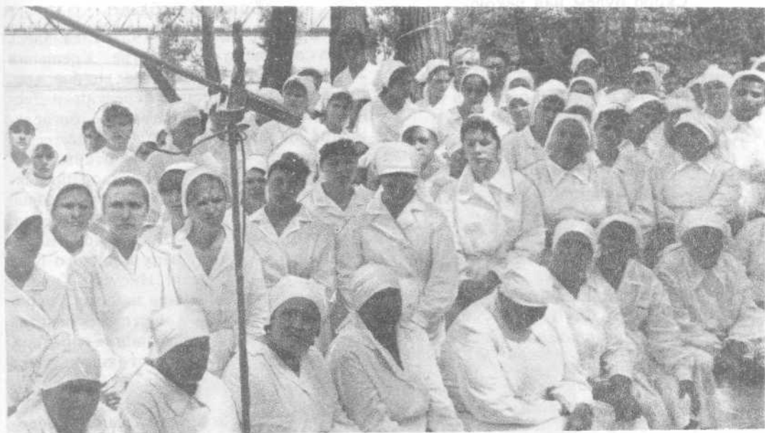
Крещаемые церкви города Киева.