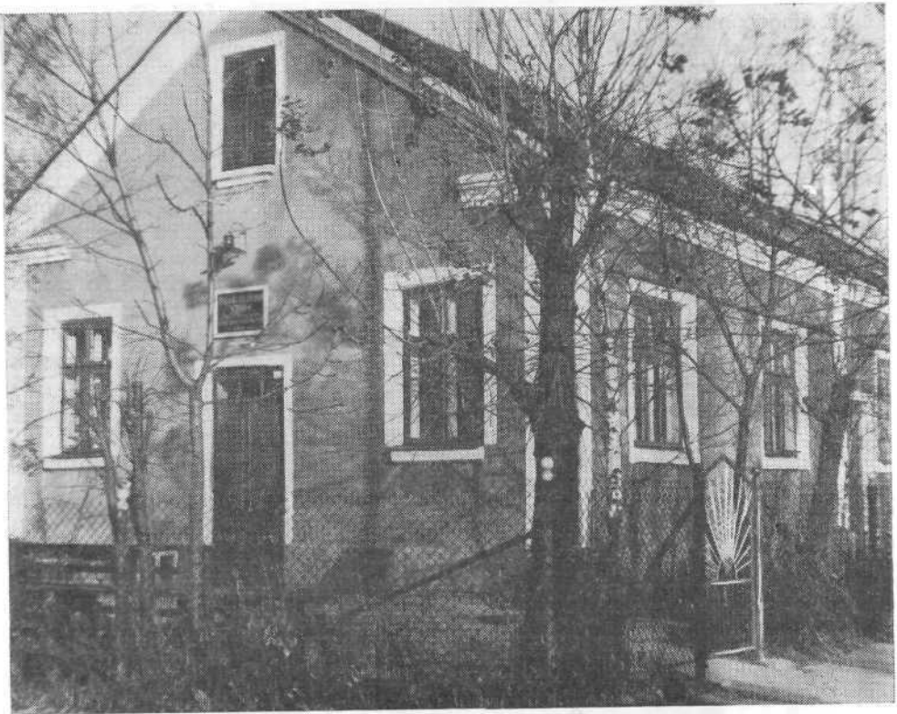
Молитвенный дом церкви города Ковеля Волынской области.

чательных слов из Второзакония 8, 2: «И помни весь путь, которым вел тебя Господь, Бог твой».