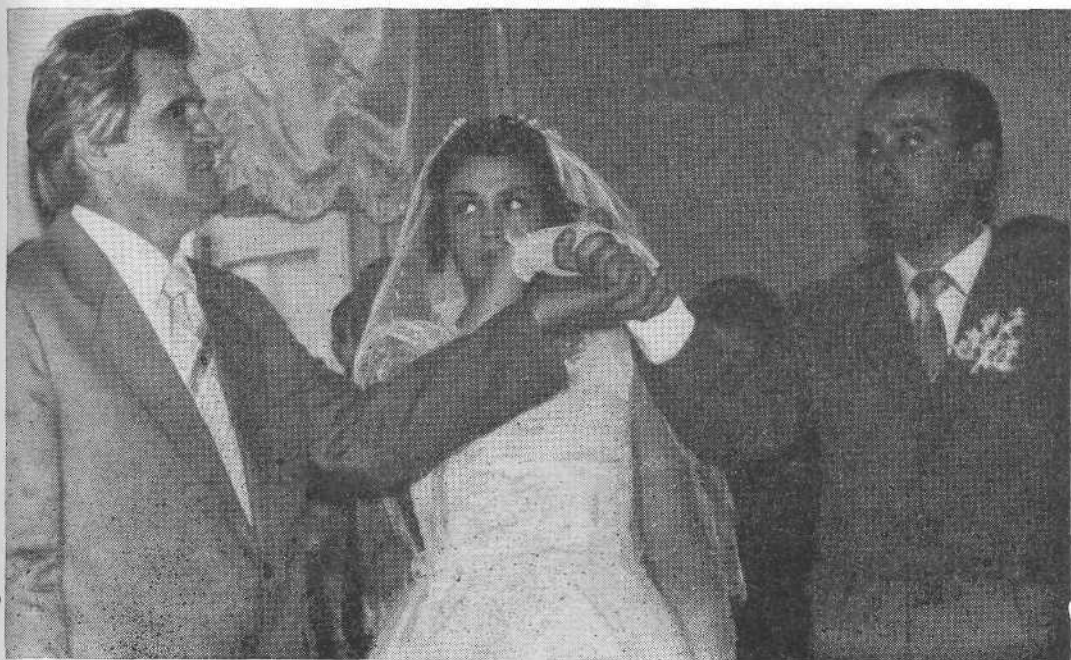
Бракосочетание в церкви города Винница.