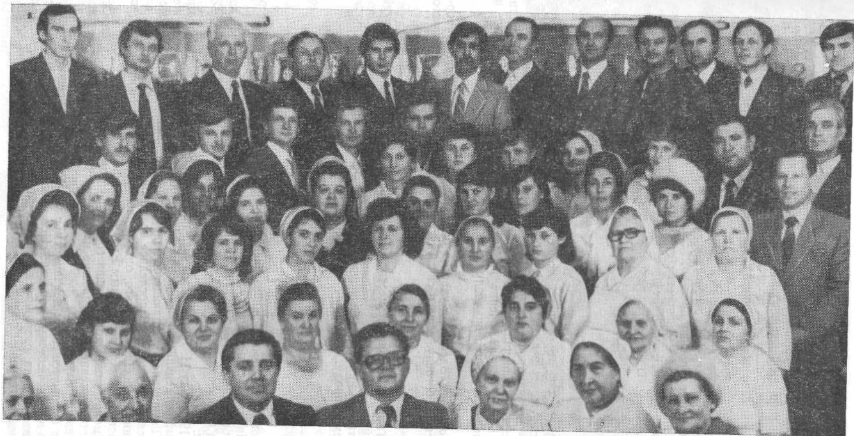
Хор церкви поселка Основа г. Харькова.