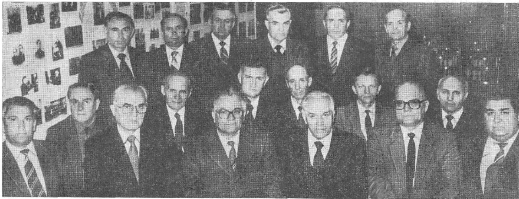
Руководители ВСЕХБ среди представителей братских менонитов.