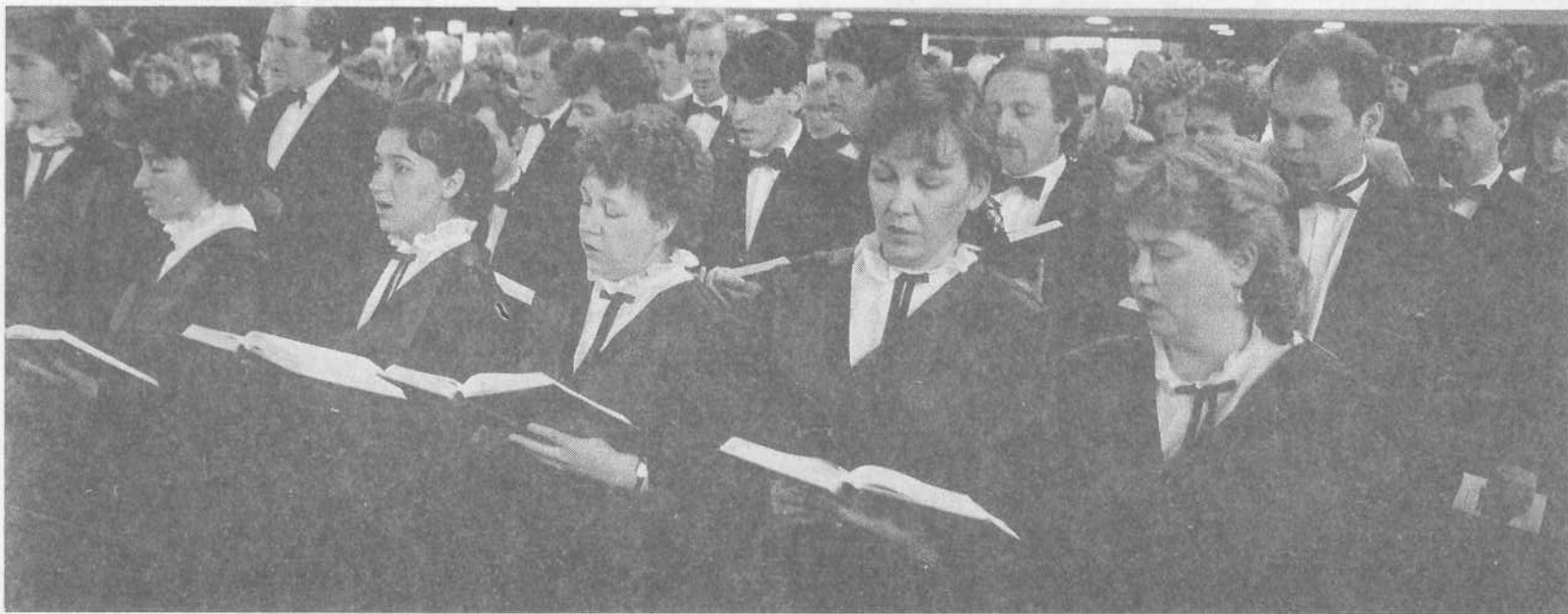
Наши сестры и братья на богослужении в одной из церквей США.