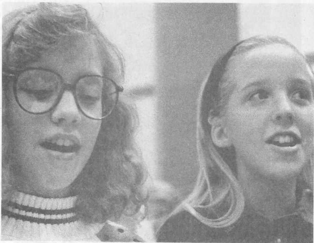
Юные американские сестры поют на богослужении.