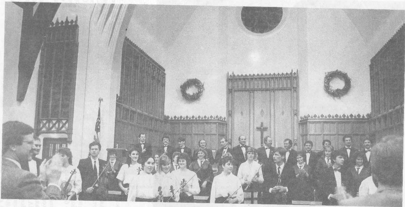
Наши хористы и музыканты отвечают на приветствие американских верующих.