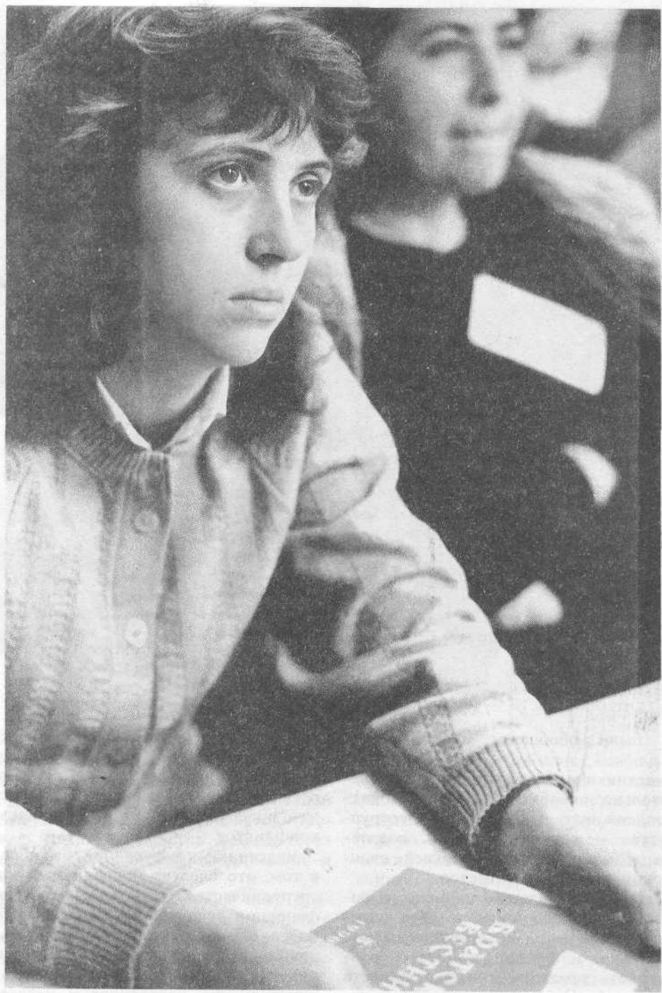
Слушание выступлений участников конференции.