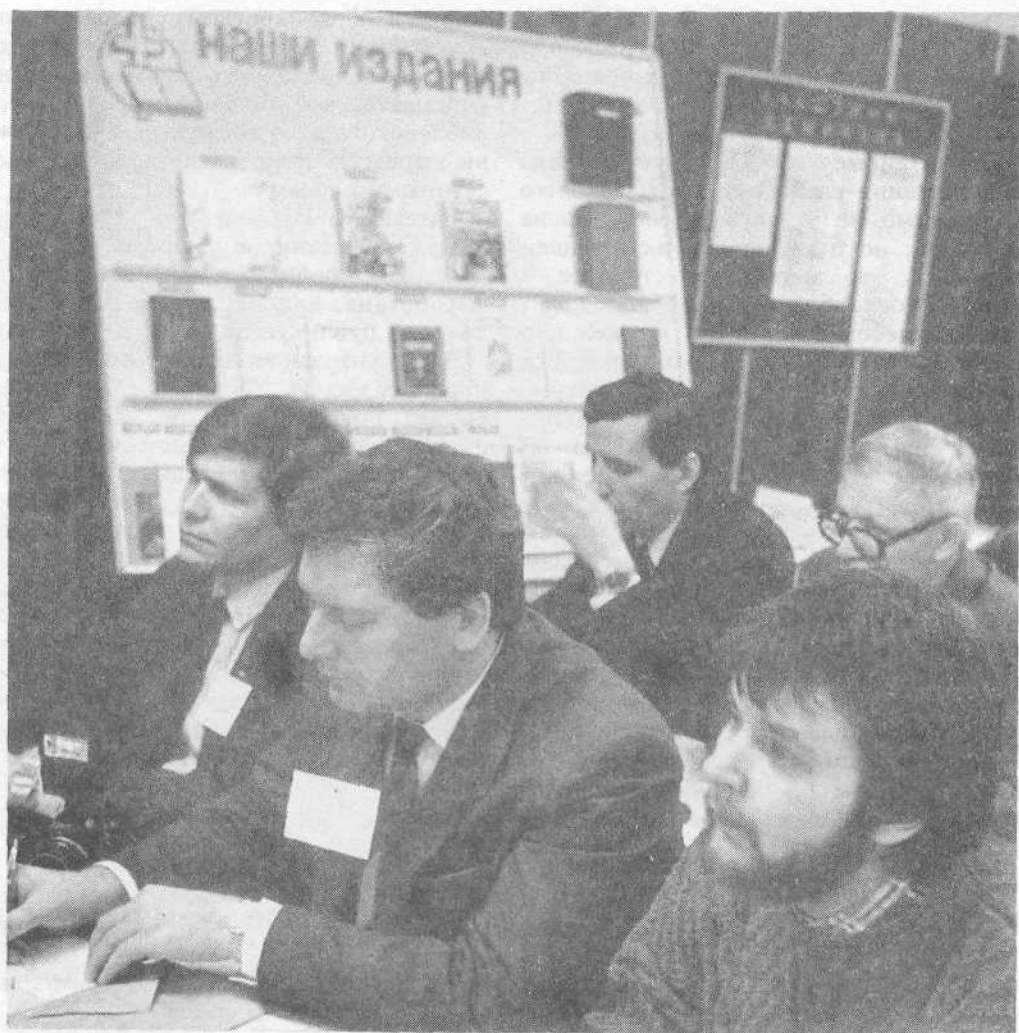
Во время заседания конференции редакторов и издателей.

сительно путей и форм сотрудничества, говорили о необходимости обмена информацией, проведения семинаров для журналистов и издателей; сбора статистических сведений и издаваемой литературы.