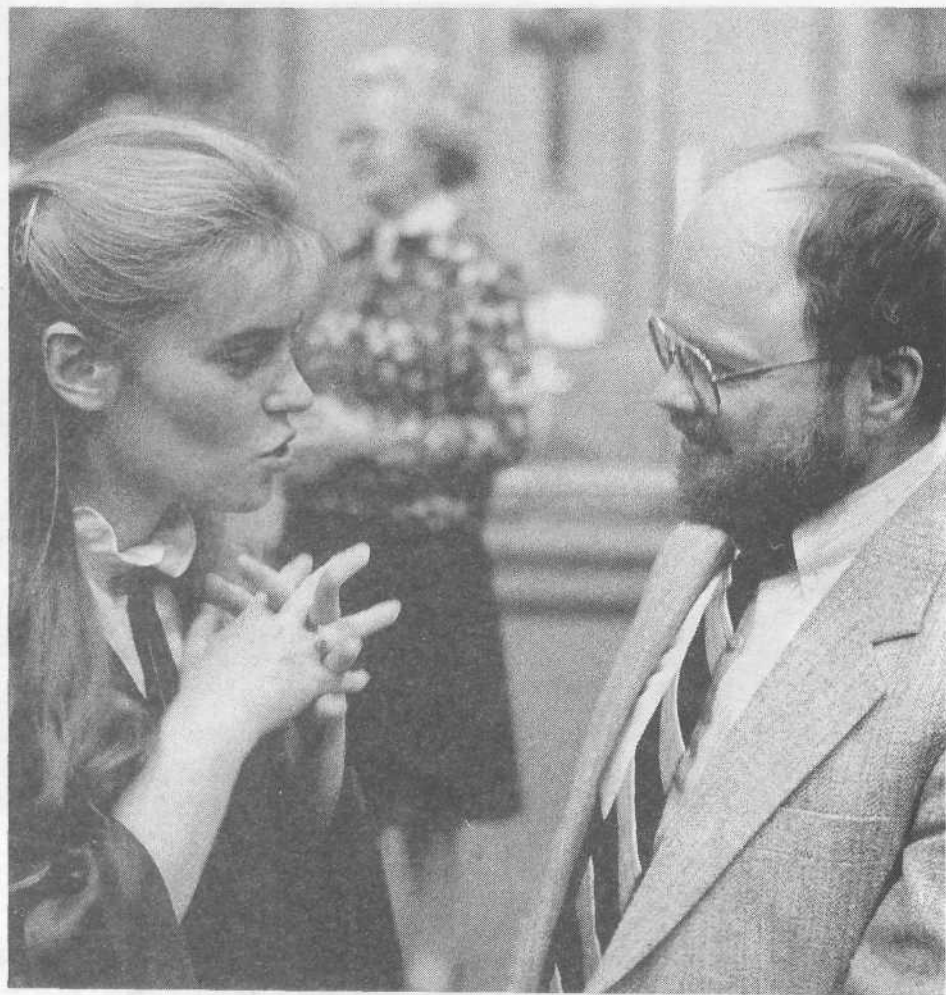
Общение после богослужения.