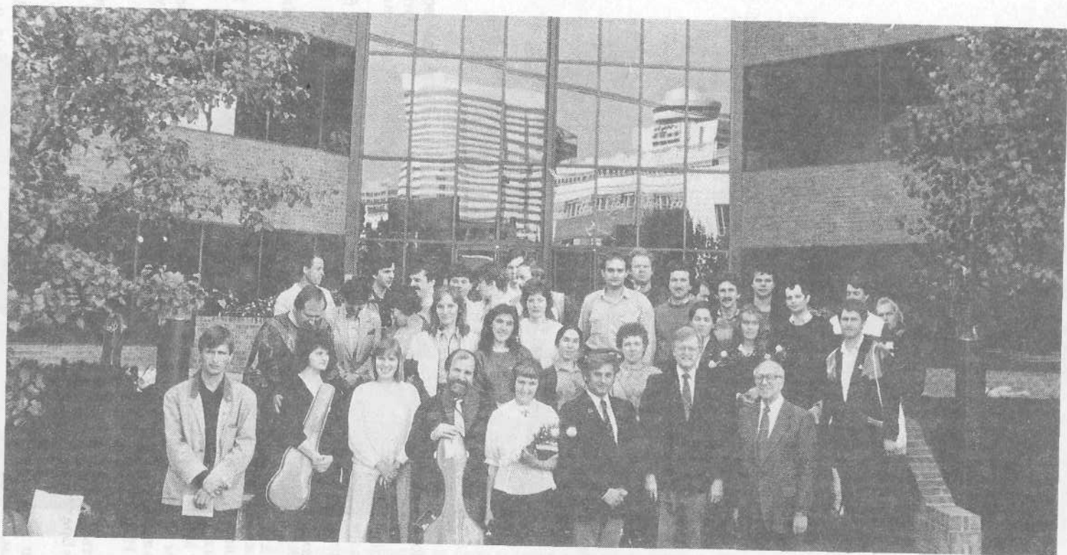
Наши певцы и музыканты у входа в одну из церквей в Соединенных Штатах.