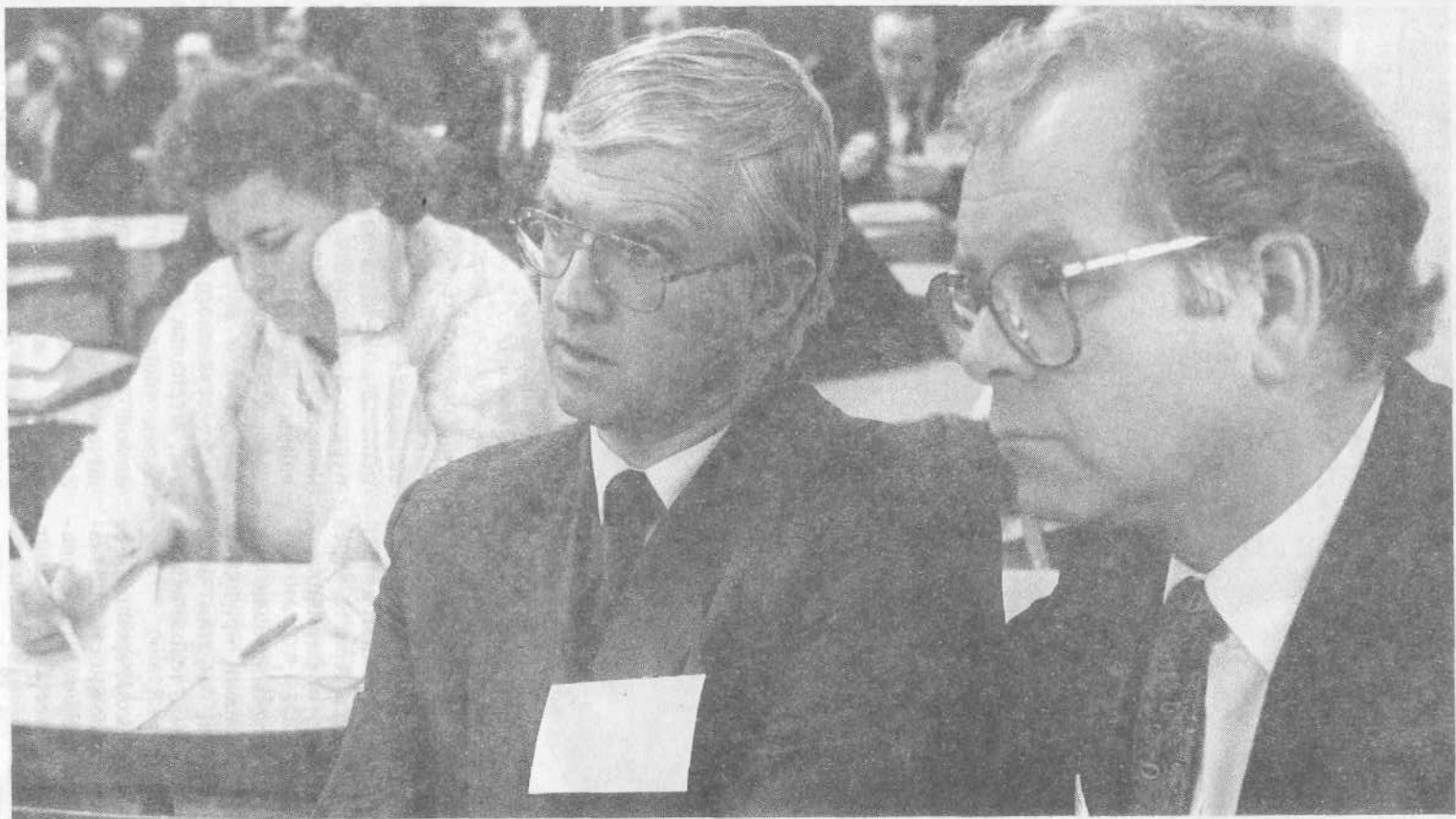
Иностранные гости на конференции редакторов и издателей.