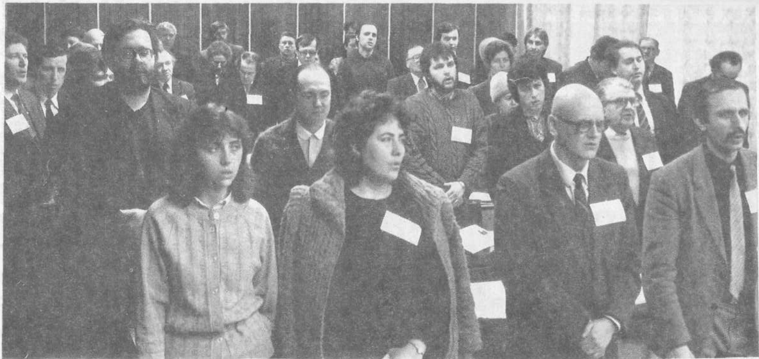
Участники конференции редакторов и издателей.

Специальное издание Содержит 10 статей и 10 иллюстраций всего 100 страниц в переплете Цена 100 копеек включая доставку и налог Заказ № 1000 по адресу: Москва, ул. Мясницкая, 10 Тел. 2-10-10