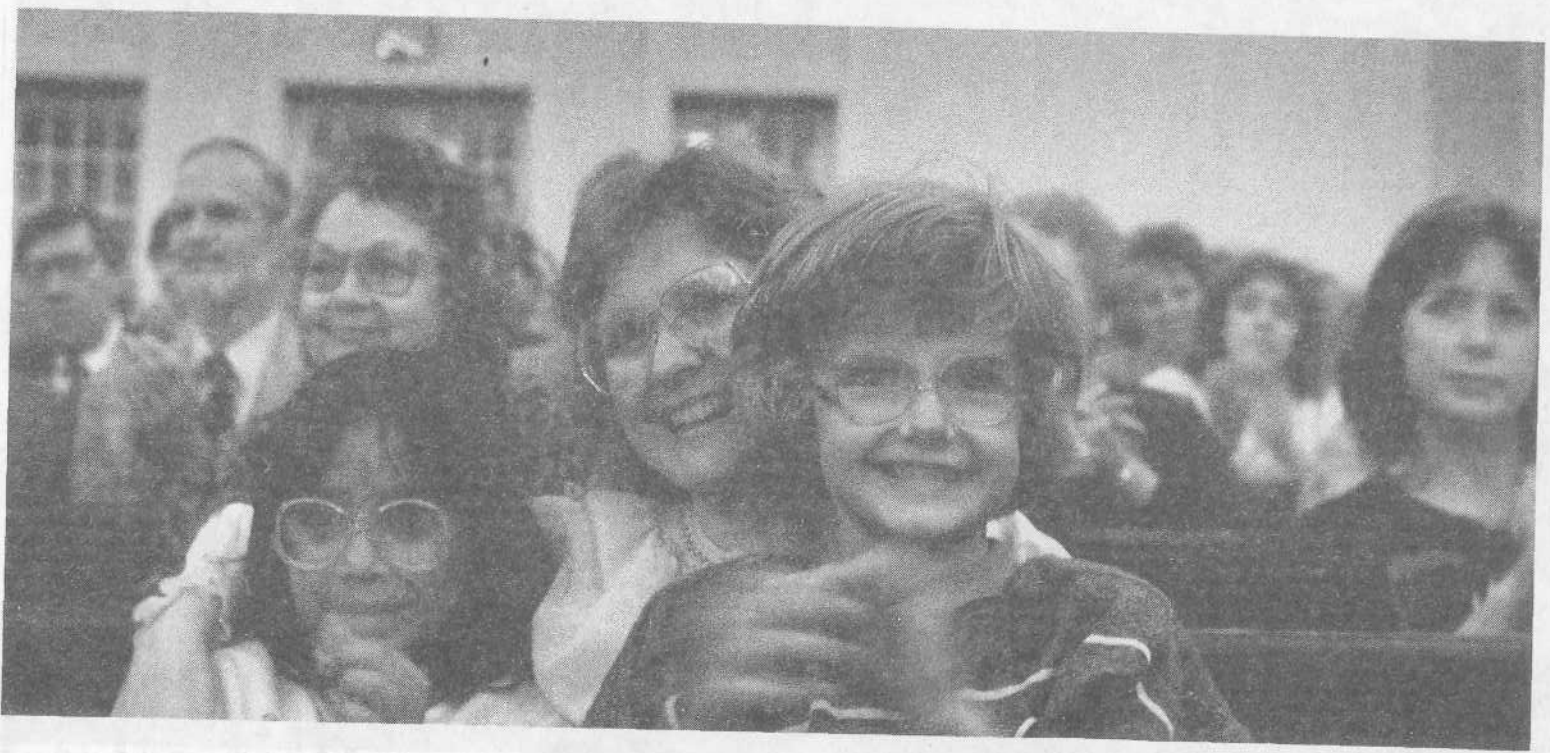
Американские верующие радуются общению с нашими братьями и сестрами.