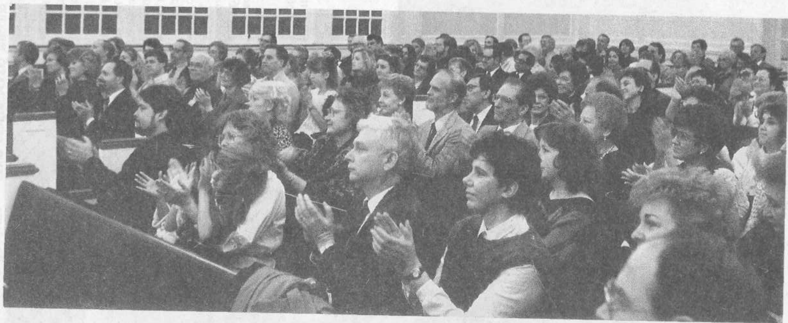
Верующие церкви Колумбия в Вашингтоне приветствуют наших певцов и музыкантов.