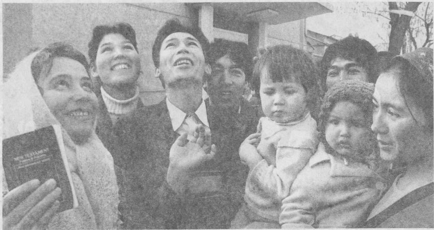
Новообращенные братья и сестры киргизы радуются о Господе.