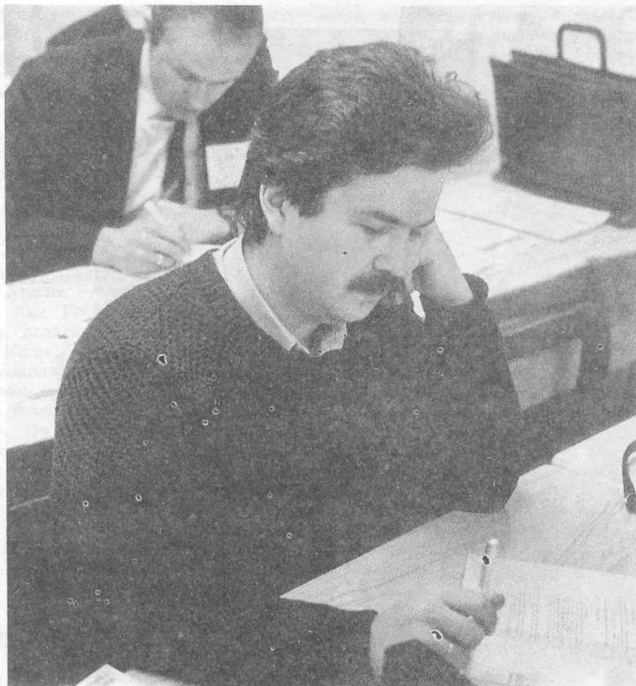
Рабочий момент конференции.

страны и возрастание Церкви Христовой, представители христианской прессы выразили общее мнение, что главной целью их деятельности является проповедь Евангелия Иисуса Христа через средства христианской информации и печати — Мр. 16, 15.