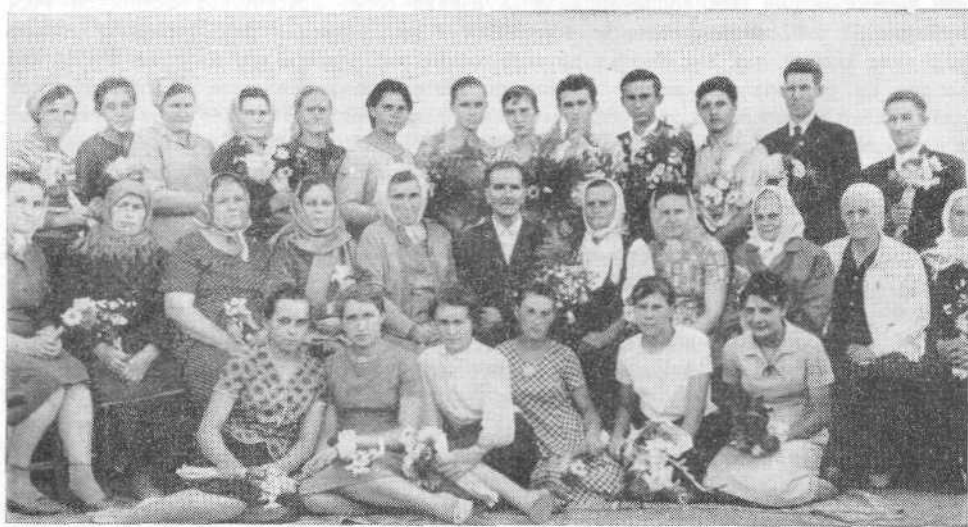
Новые члены, принятые в первую Алма-Атинскую общину в 1967 году

Никогда не будем забывать, что все окружающие нас люди должны видеть в нас свет Христов, благоухание Христово, письмо Христово.