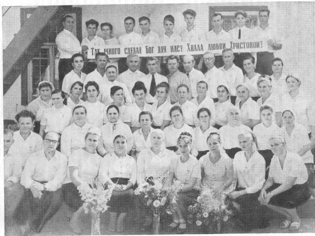
Состав хора. В центре — директор школы, председатель комитета по делам молодежи, секретарь комитета по делам молодежи, члены комитета по делам молодежи. Справа — председатель комитета по делам молодежи, секретарь комитета по делам молодежи, члены комитета по делам молодежи.