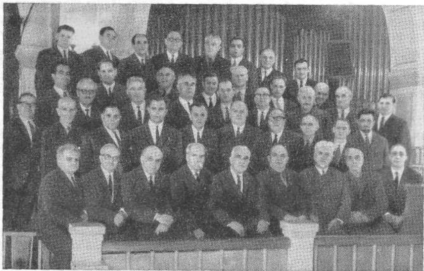
Участники Пленума ВСЕХБ (декабрь 1967 г.)

Всем, приславшим свои поздравления, ВСЕХБ выражает свою сердечную благодарность и со своей стороны желает всем обильных Божьих благословений!