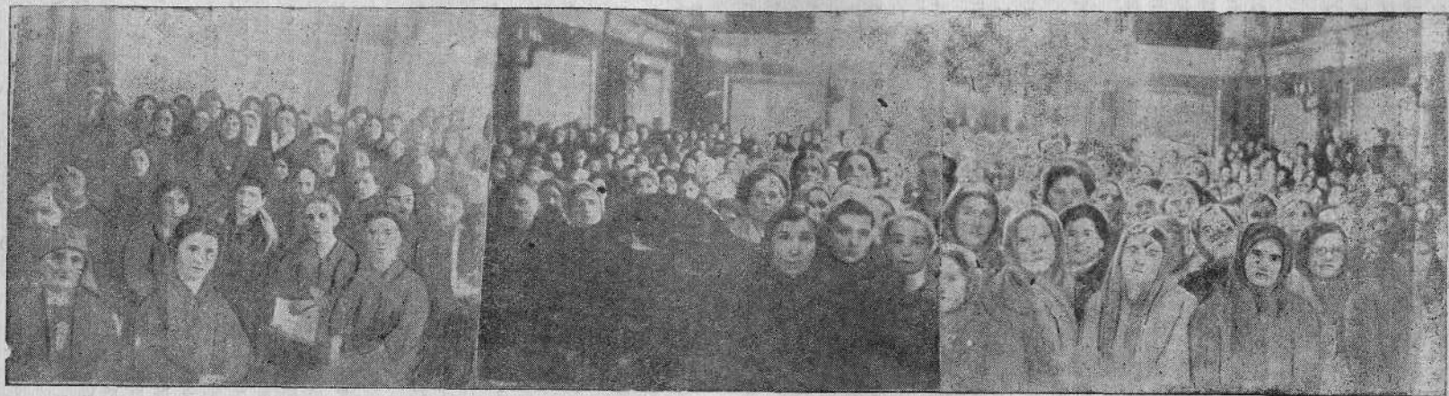
Молитвенное собрание Московской общины евангельских христиан и баптистов в день открытия Совецания