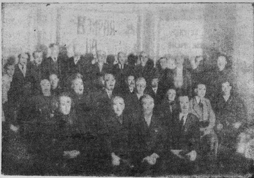
Часть делегатов Совещания

поколения,— в эти дни мы — ВСЕХиБ — черпали силу из вышеприведенного текста Св. Писания. Они были произнесены в часы военной тревоги.