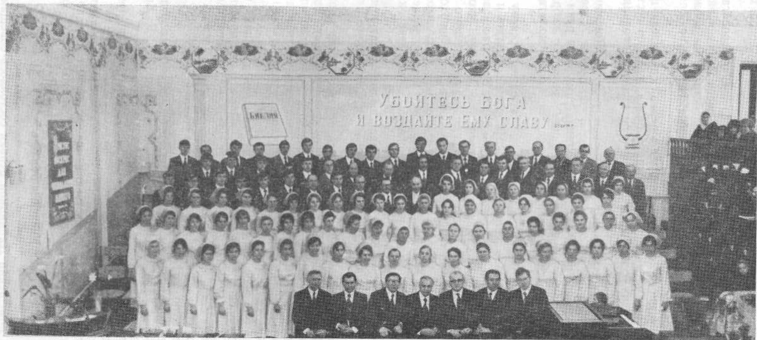
Руководящие братья ВСЕХБ среди хористов Майкопской церкви.