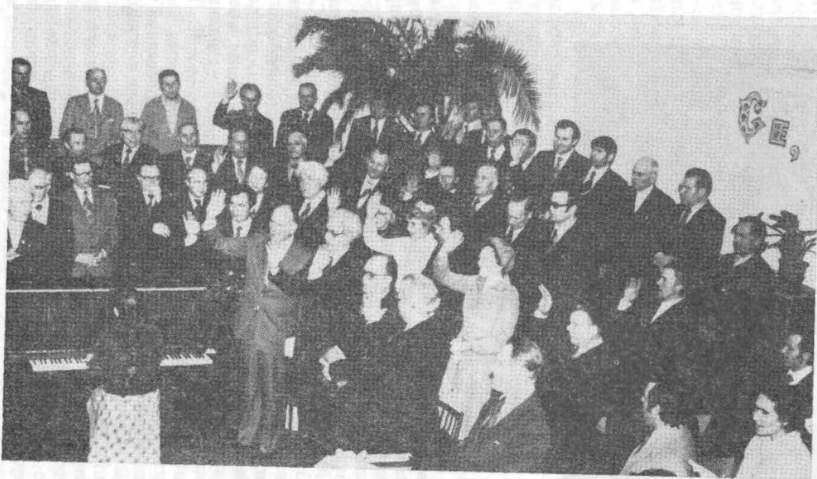
Руководители ВСБ прощаются с верующими Дарницкой церкви.