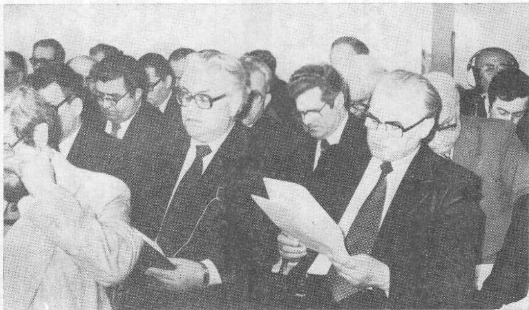
Заседание семинара «Созидание доверия — избранье жизни».