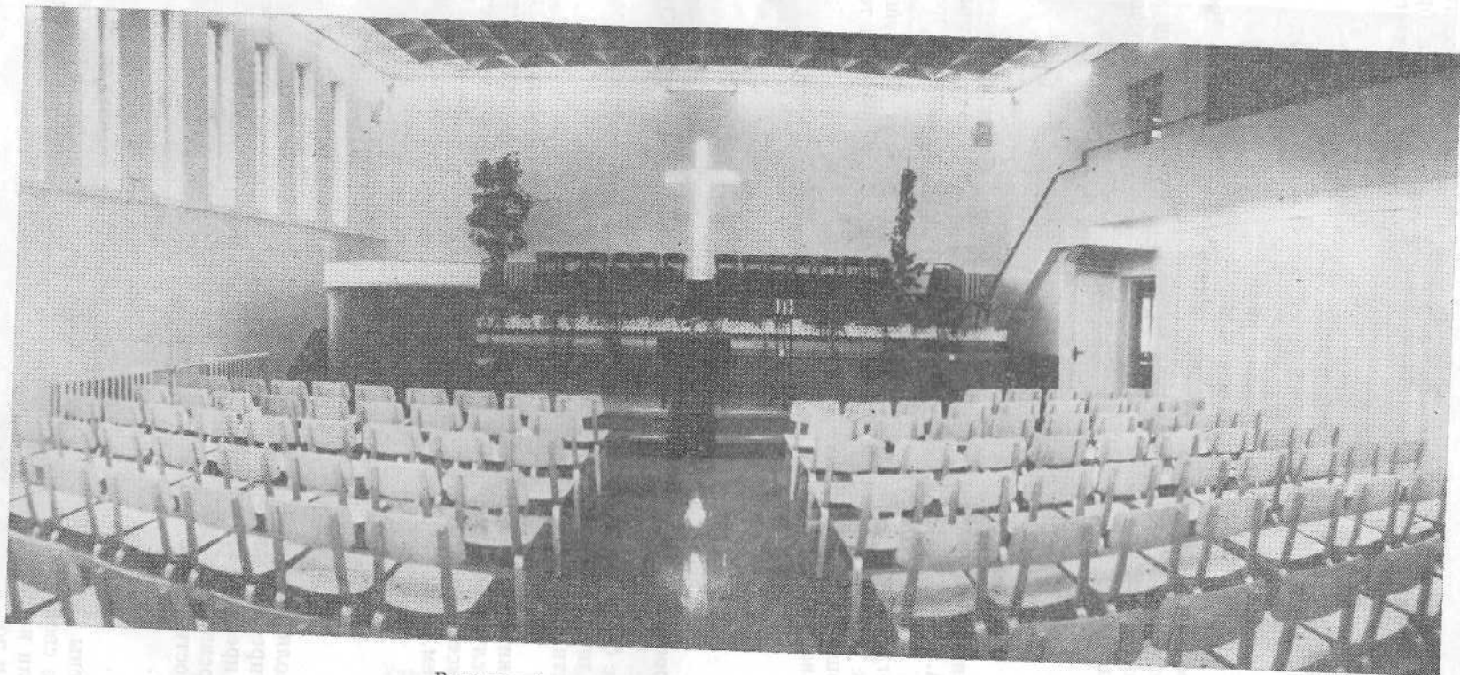
Внутренний вид нового молитвенного дома в Кохтла-Ярве.