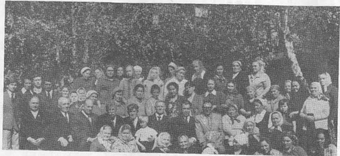
Верующие церкви города Златоуста.

Илисто-Белозорска епархия Илисто-Белозорска епархия Илисто-Белозорска епархия