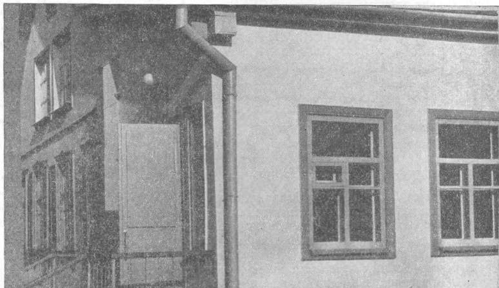
Новый молитвенный дом Воронежской церкви