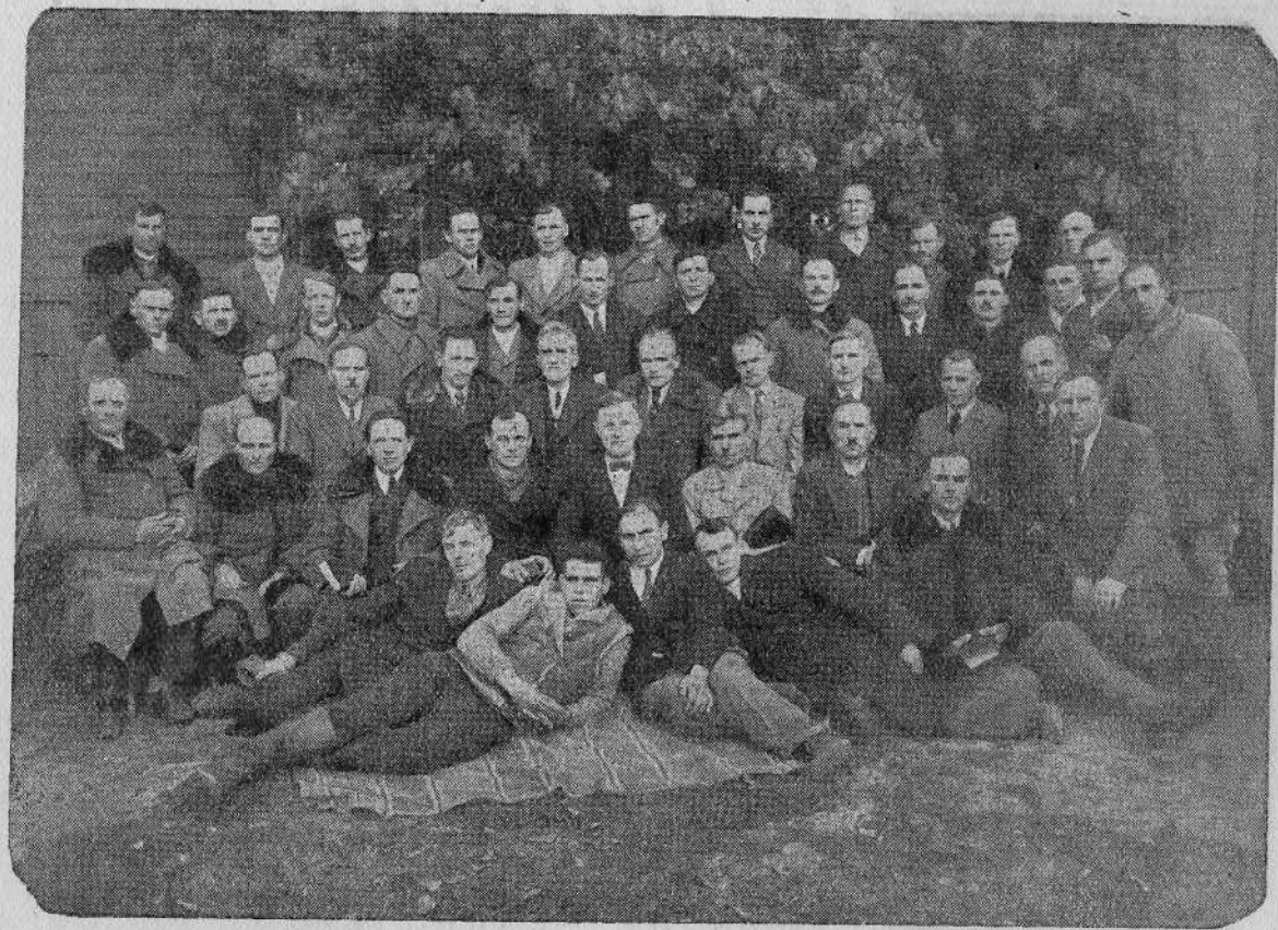
Группа пресвитеров Брестской области БССР