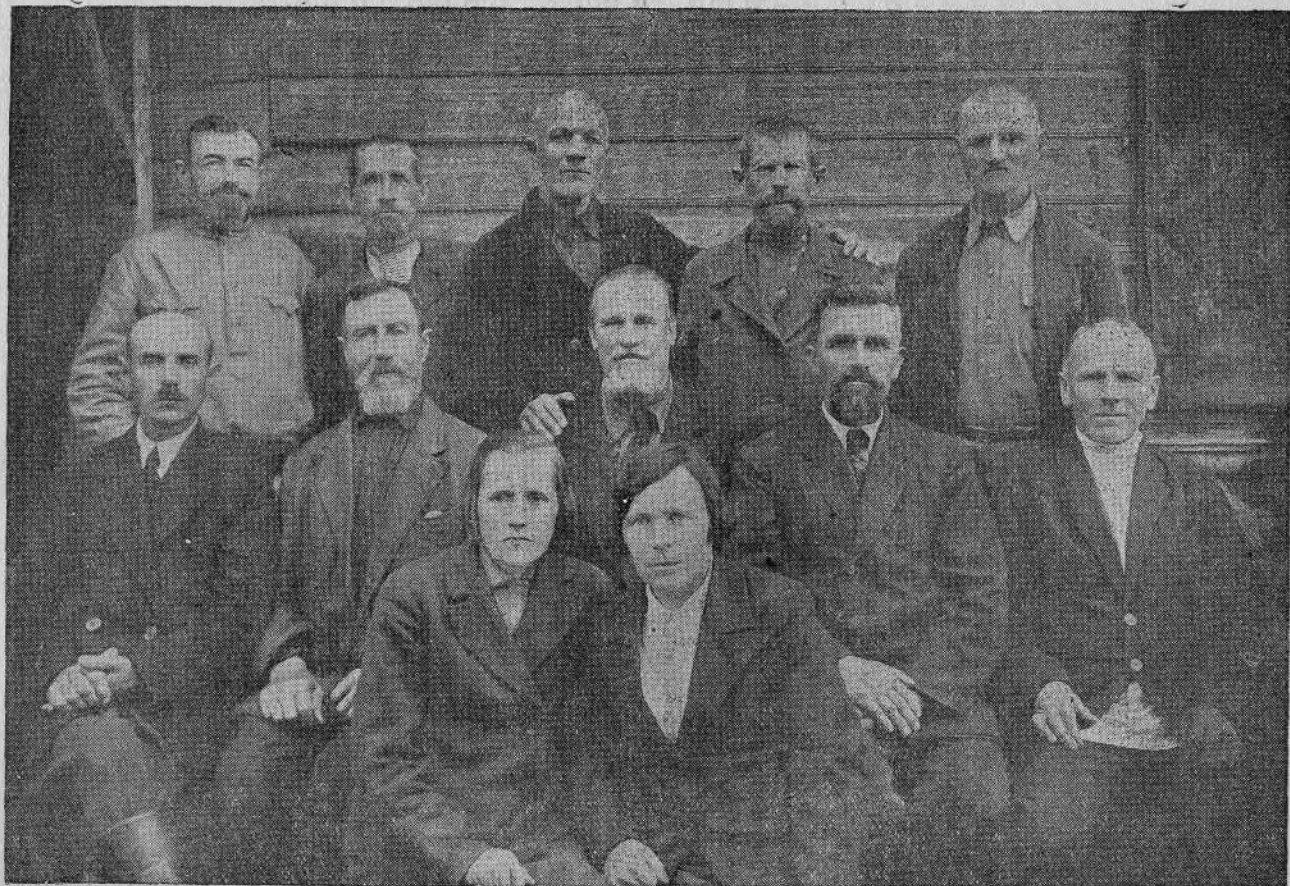
Группа пресвитеров Калининской области