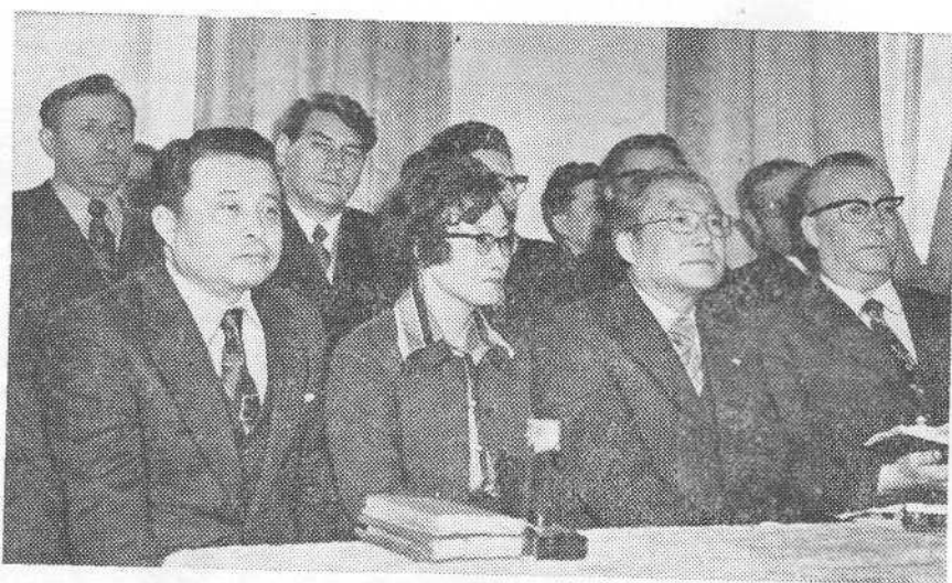
Японская делегация на богослужении в Волгоградской церкви.

Свое письмо А. Кисель закончил следующими строками: