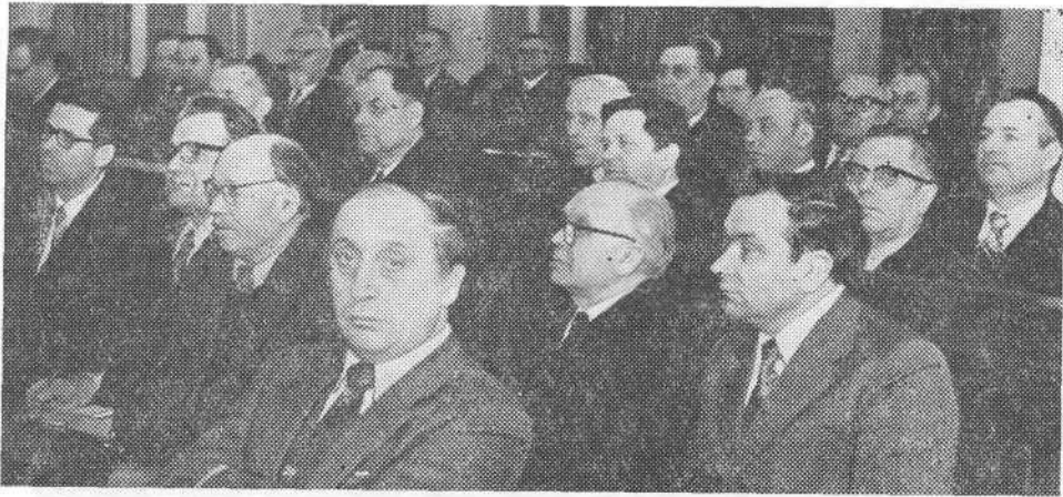
Заседание Пленума ВСЕХБ.

лось посещению наших поместных церквей, при общении с которыми мы были свидетелями глубокой радости и хвалы Богу за действия Духа Святого, так как «все мы одним Духом крестились в одно тело, иудеи или еллины, рабы или свободные, и все напоены одним Духом» (1 Кор. 12, 13).