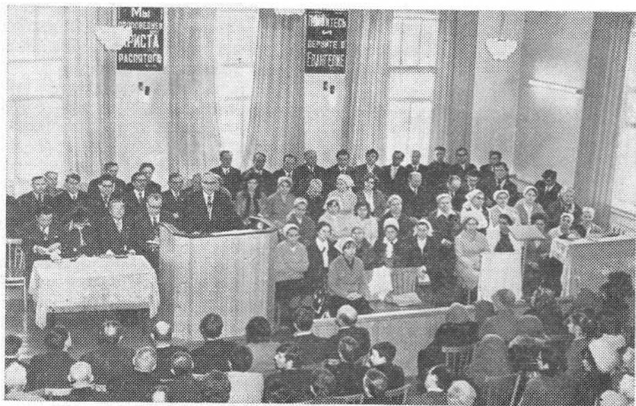
Богослужение в Волгоградской церкви.

им; оно означает добродетель, праведность, справедливость. Иисус Христос призывает всех людей к праведной жизни. «Покайтесь, ибо приблизилось Царство Небесное» (Матф. 3, 2). «Идите за Мною» (Матф. 4, 19). «Я есмь Путь, Истина и Жизнь» (Иоан. 14, 6). «Верующий в Сына имеет жизнь вечную» (Иоан. 3, 36).