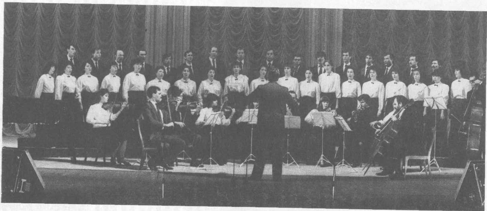
Хористы Московской церкви выступают на благотворительном концерте в Большом театре.