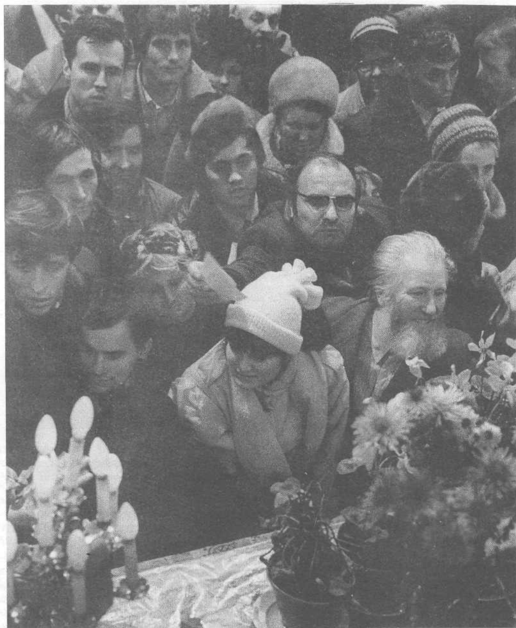
Во время евангелизационного собрания в Московской церкви.