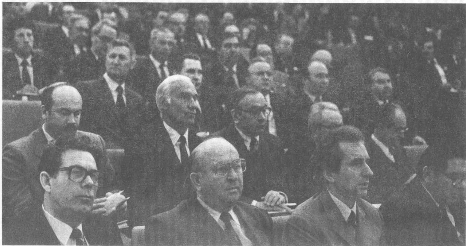
Участники пленума ВСЕХБ.