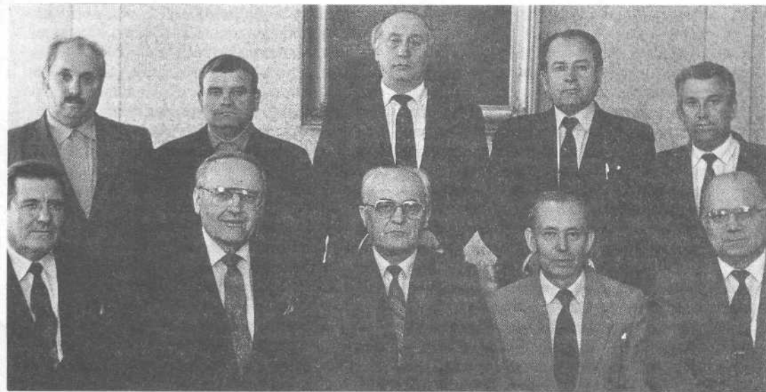
Гости в канцелярии ВСЕХБ.

служения состоялась встреча с молодежью Московской церкви.