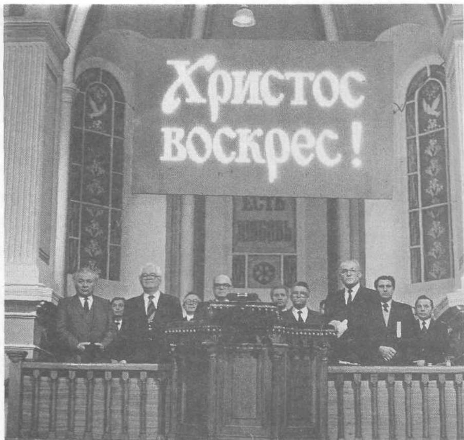
Пасхальное богослужение в Московской церкви.