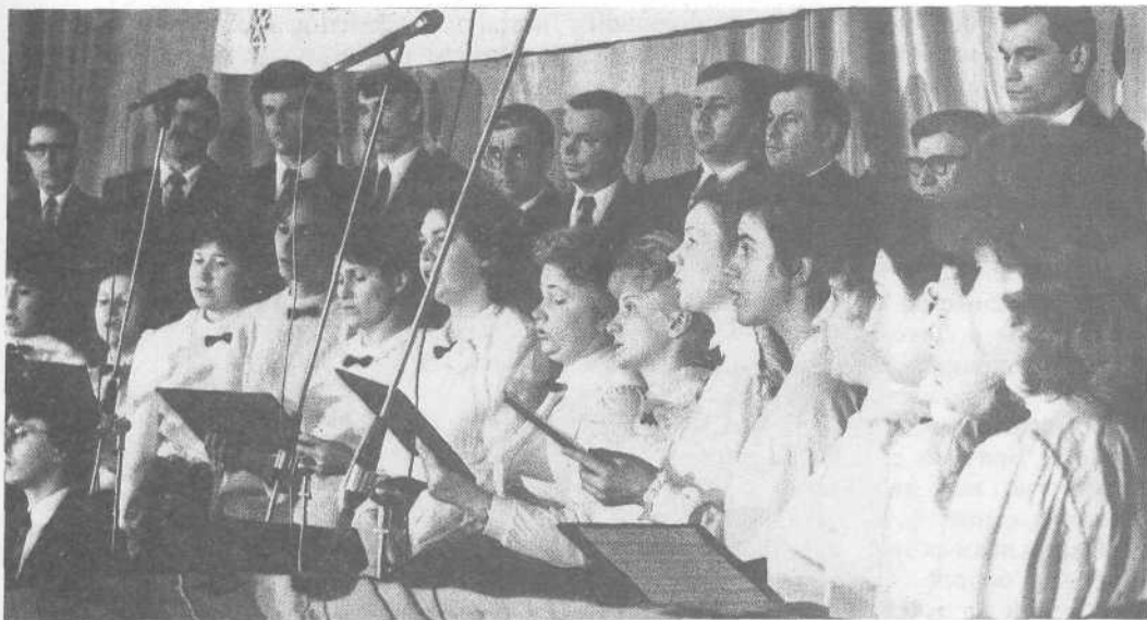
Хористы Московской церкви поют на праздновании 1000-летия Крещения Руси в городе Костроме.