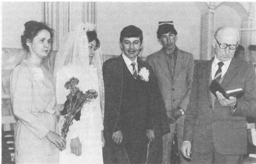
Бракосочетание в церкви города Фергана.

далось пением хора, выступлением отдельных групп певцов, декламациями.