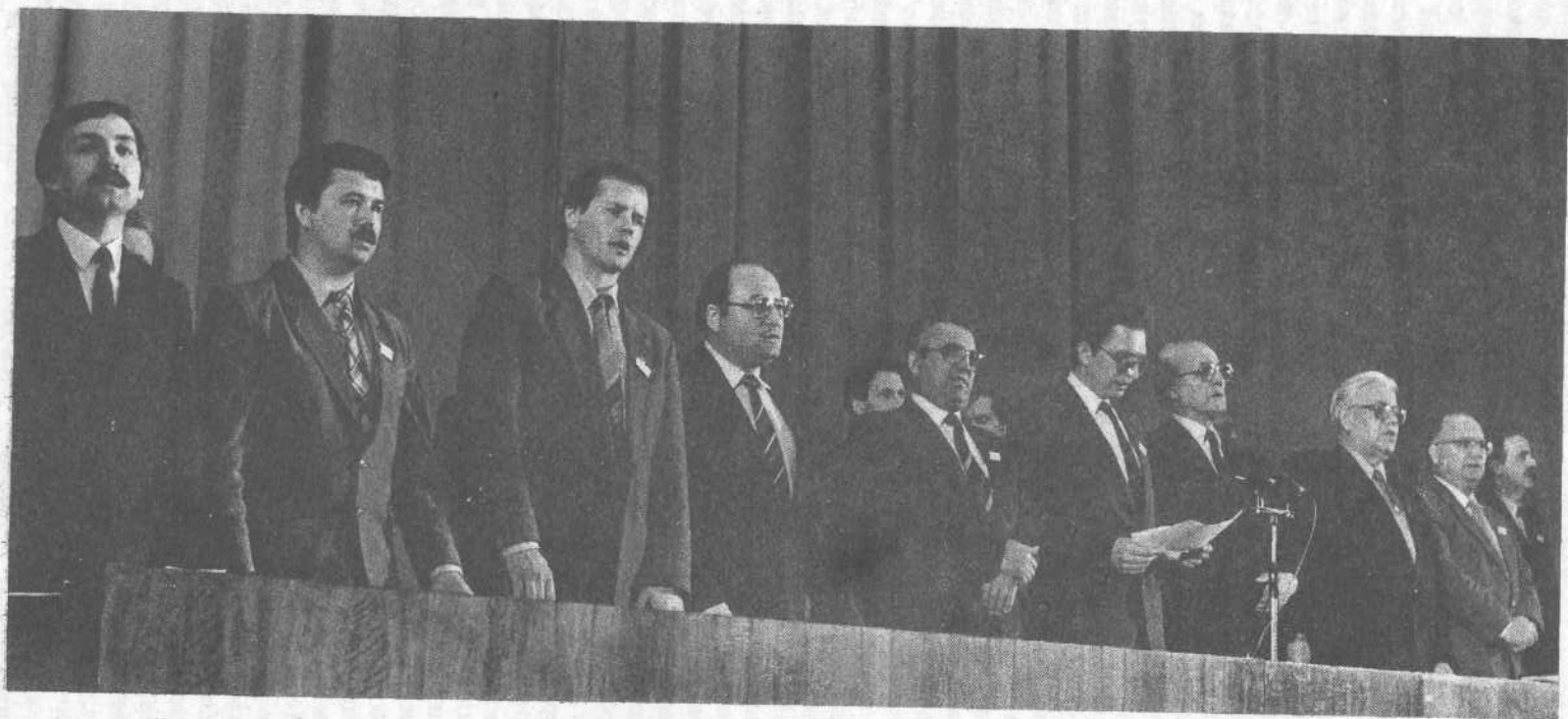
Президиум молодежной конференции.