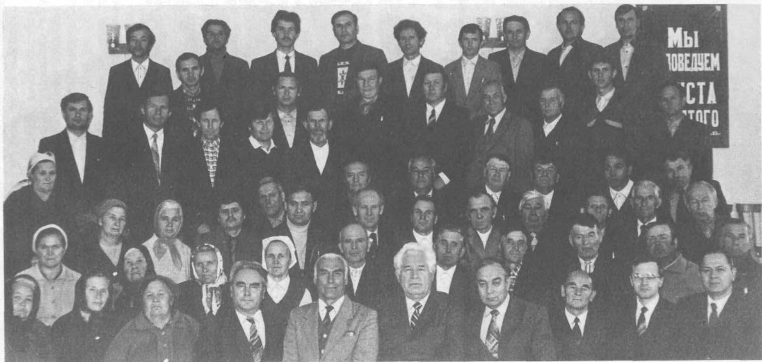
Представители ВСЕХБ среди верующих церкви Абакана.