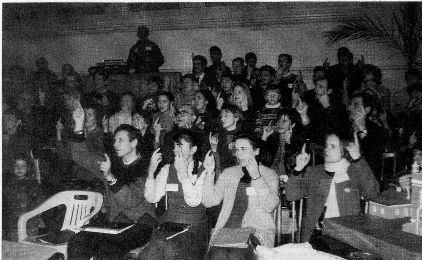
Богослужение в церкви "Веры и тишины" г. Нижний Новгород