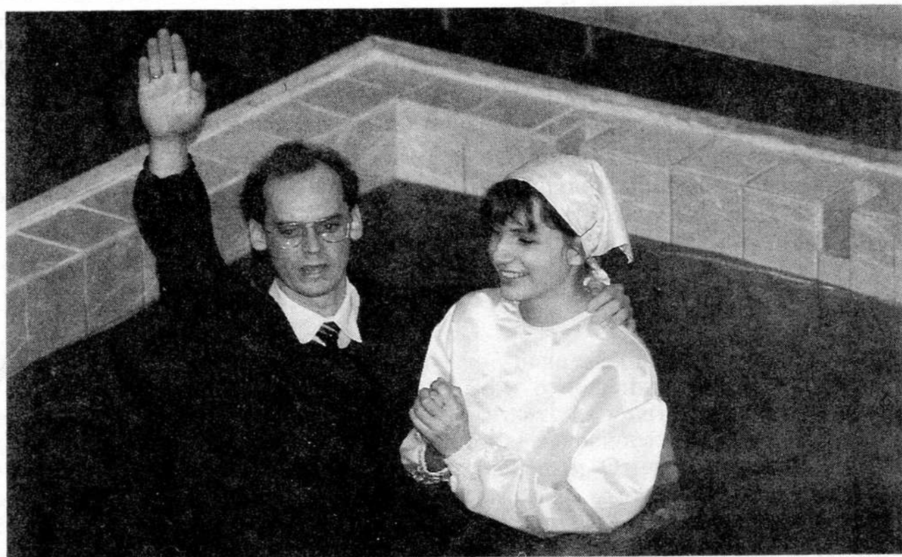
Крещение по вере в церкви города Мытищи