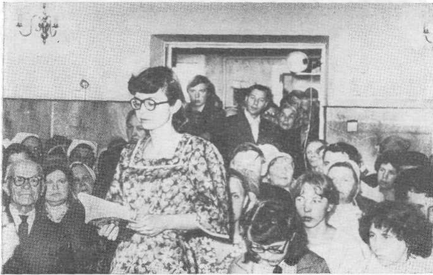
Богослужение в церкви г. Кубинка Московской области.

2 февраля с. г. в церкви состоялось траурное богослужение. Дом молитвы был заполнен теми, кого учил, наставлял и много раз посещал почивший.