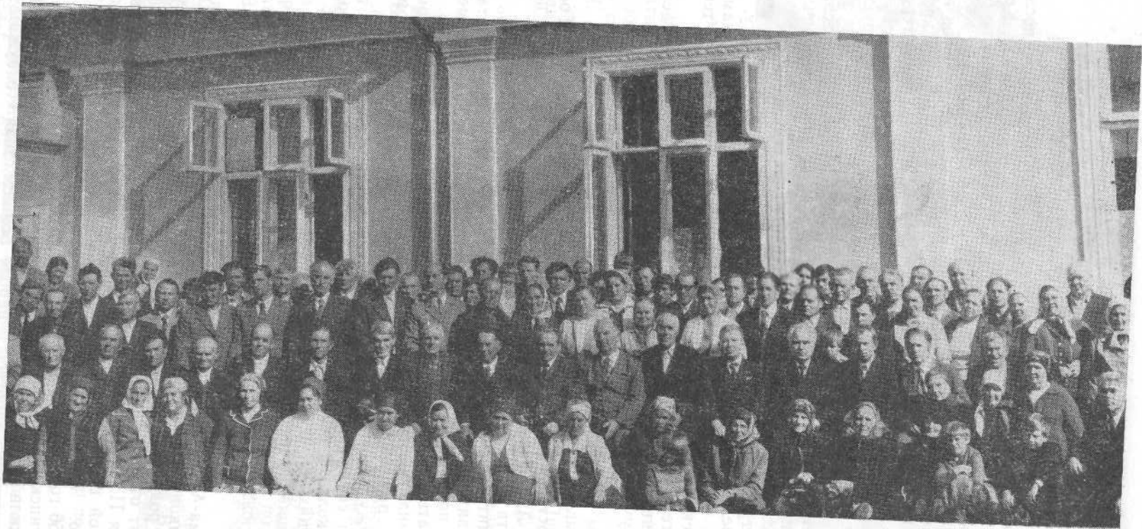
Верующие церкви с. Струзовка, Молдавия,