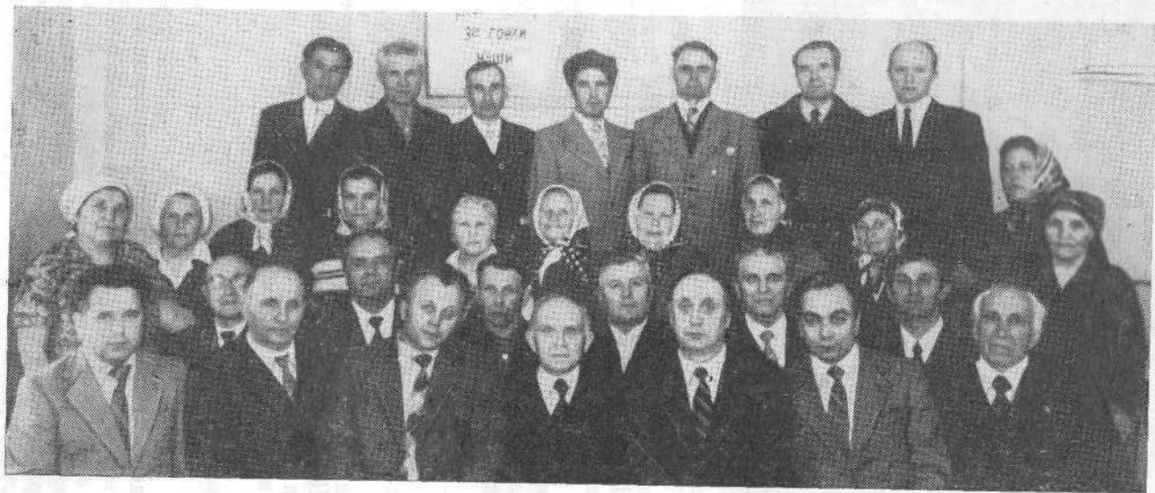
Участники семинара представителей церквей Тульской, Калужской и Рязанской областей.