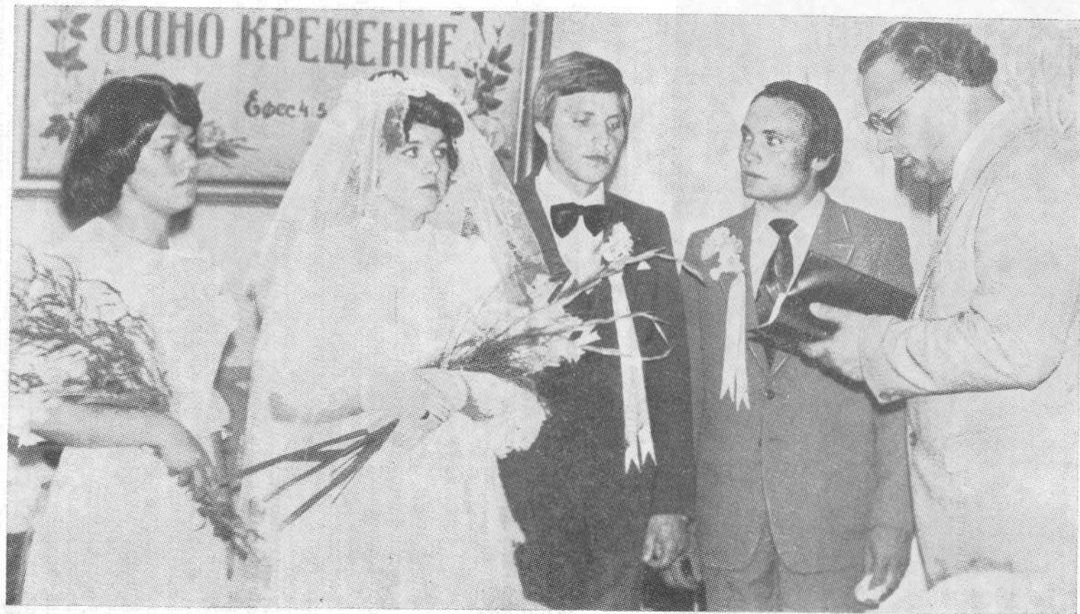
Бракосочетание в церкви г. Днепрпетровска.