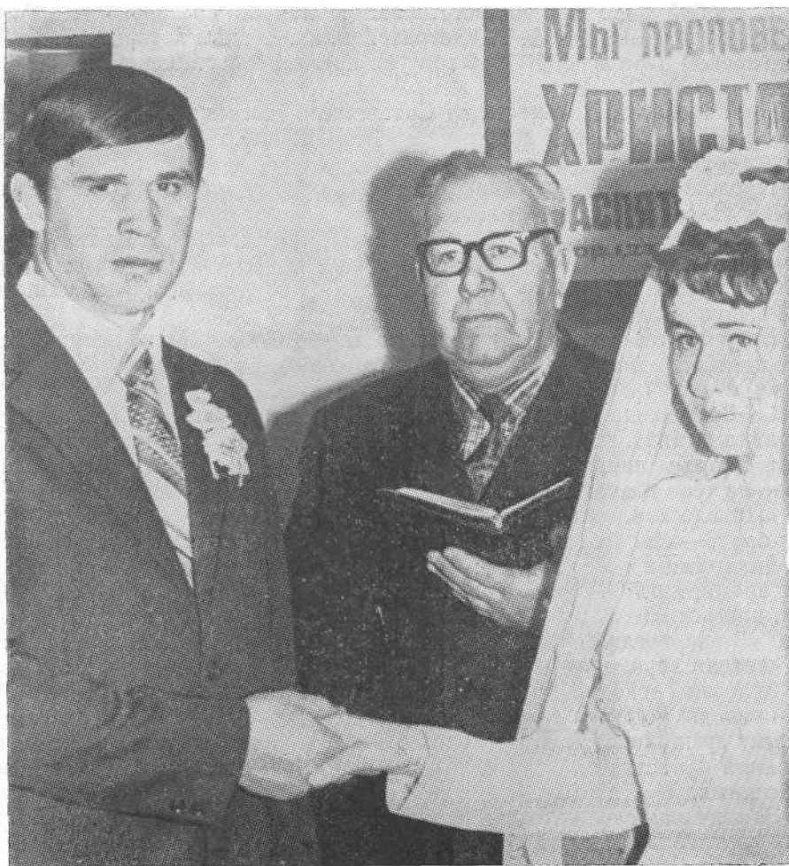
Бракосочетание в Иркутской церкви.