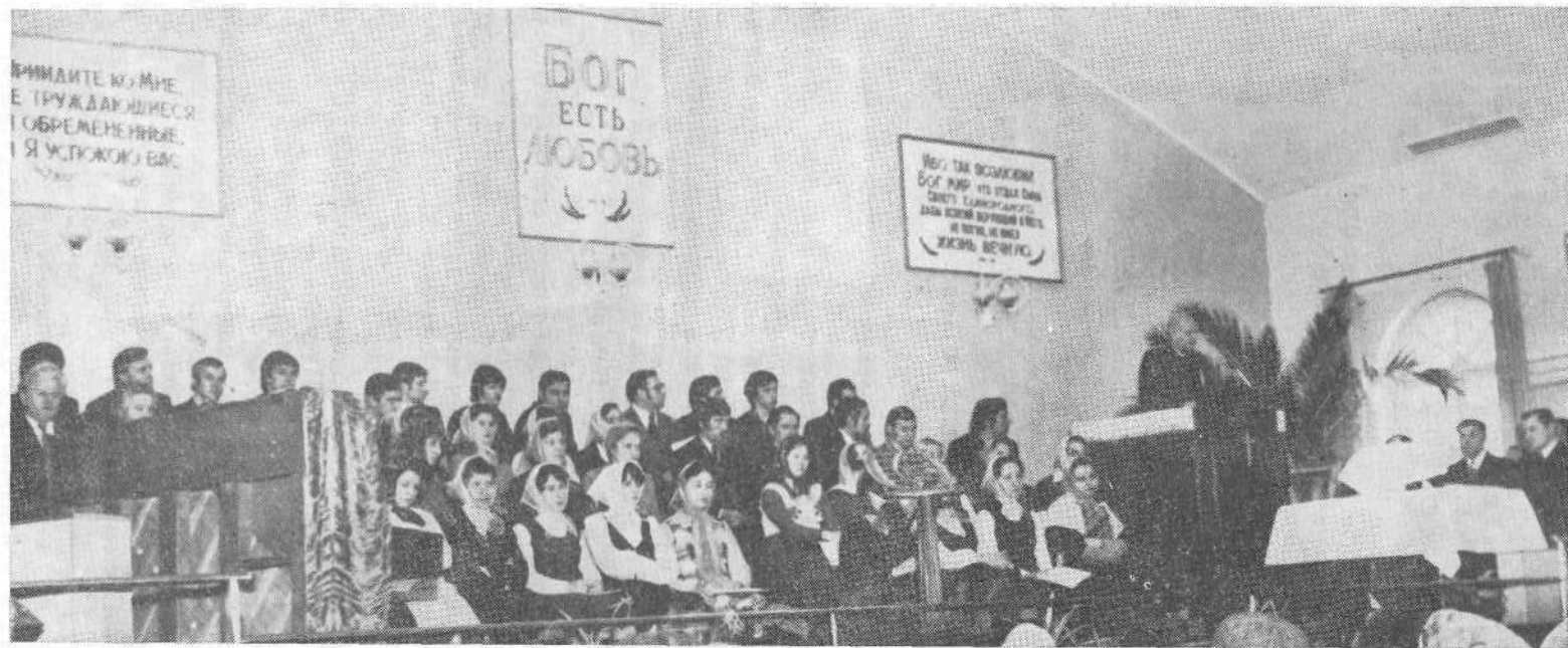
Хористы Вильнюсской церкви.