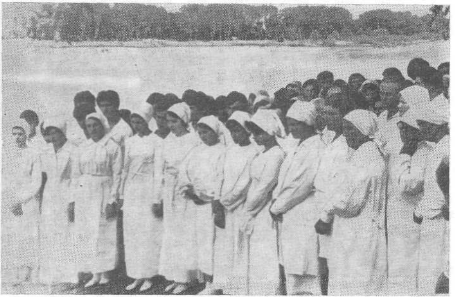
Крещение церкви с. Комарово Черновицкой области.