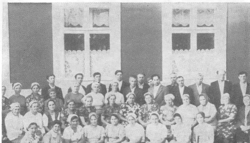
Хористы церкви с. Комарово Черновицкой области.