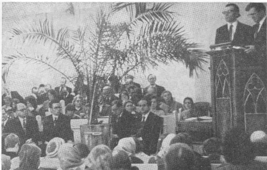
Богослужение церкви г. Талсы.

мой друг, и ты придешь ко мне», — так писал Л. Бетховен в письме к Аменде.