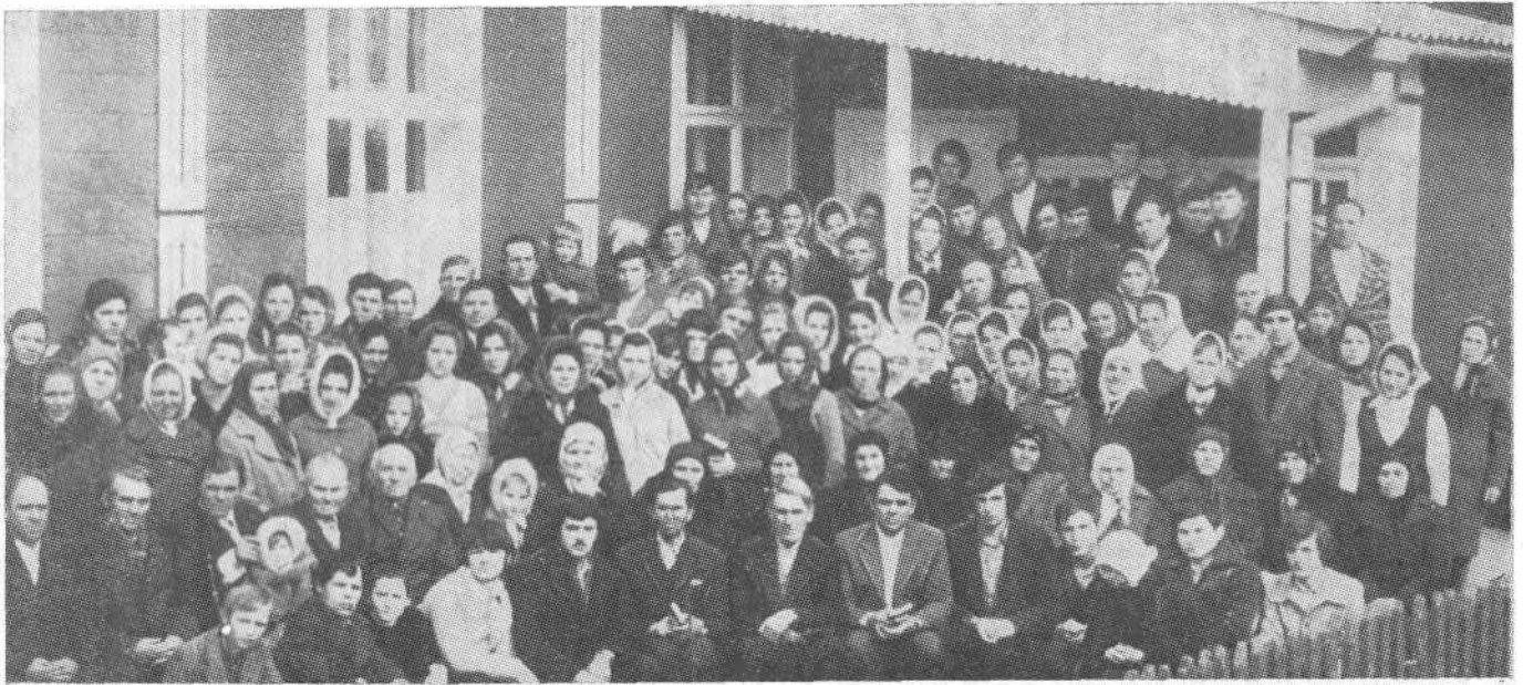
Верующие церкви с. Н. Братушаны, Молдавия