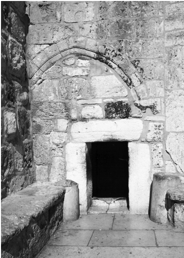
Вход в Храм Рождества Христова

В 1244 году Вифлеем был опустошен хорезмийцами, а в 1489 году почти совершенно уничтожен. Восстановлен он был только в последние столетия.