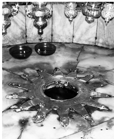
Звезда в Храме Рождества на месте, где родился Христос

В Вифлееме во II веке после второй римско-иудейской войны на месте Рождества Иисуса Христа римляне поставили святилище Адонису, кото-