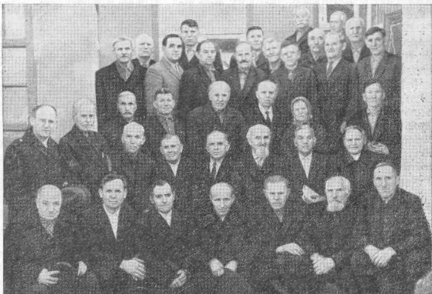
Пресвитерское совещание в Курске 11—12 октября 1968 г.