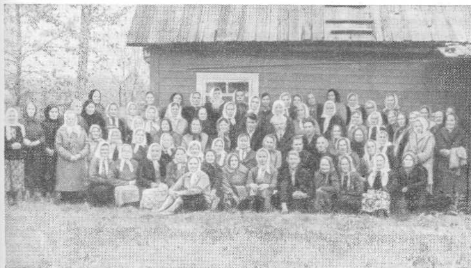
Архангельская церковь ЕХБ

Архангельск. Верующие Архангельской церкви дружной, монолитной семьей славят своего Господа, живя в мире и любви между собой, не увлекаясь никакими ветрами учений. Община бодрствует, возрастая духовно и численно. Пресвитером об-