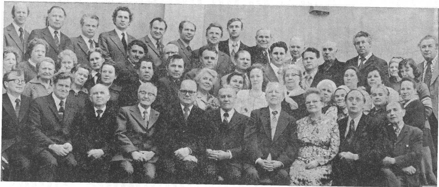
Гости Венгрии (в центре) среди руководства и сотрудников ВСЕХБ и МОЕХБ.