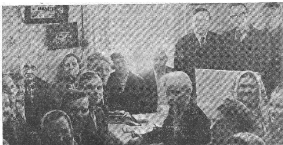
Богослужение в Карело-Тимошкинской церкви.