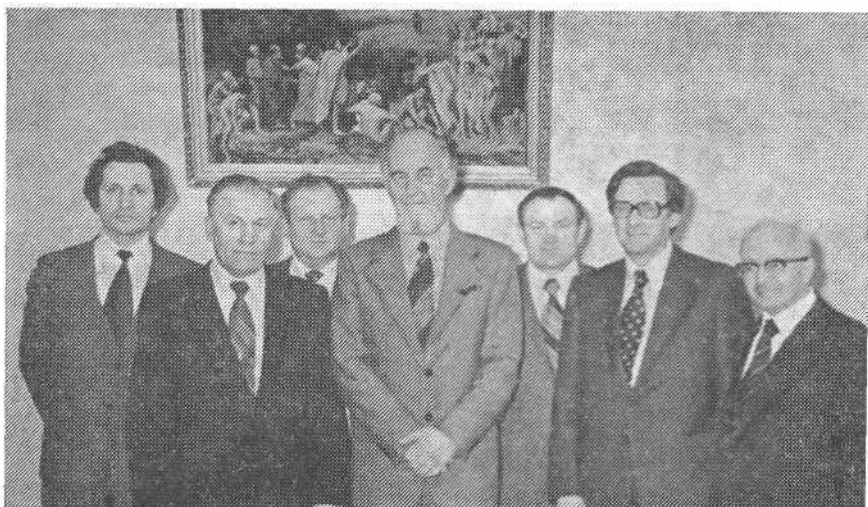
Представители Всемирного Совета церквей в канцелярии ВСЕХБ.