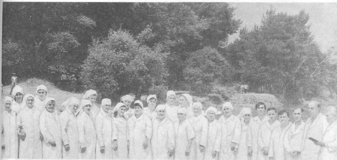
Перед крещением новых членов церкви города Гори.

литвах верующие просили Господа о ниспослании благословений на труд служителя.