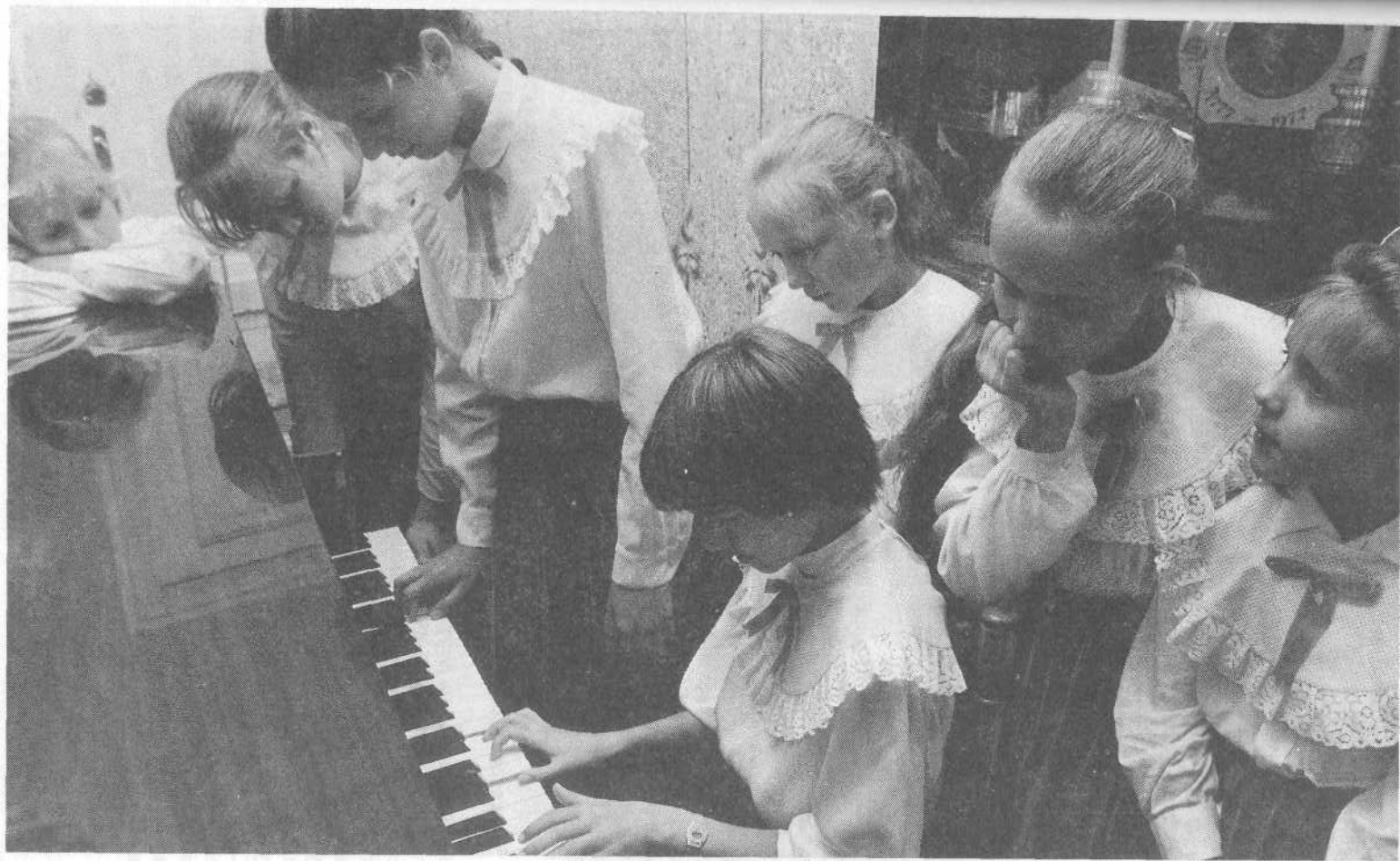
Общение детей верующих Московской церкви.