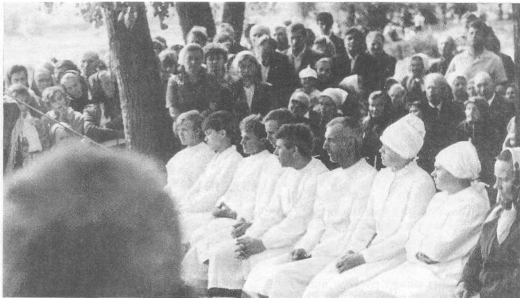
Крещаемые церкви города Ковеля.