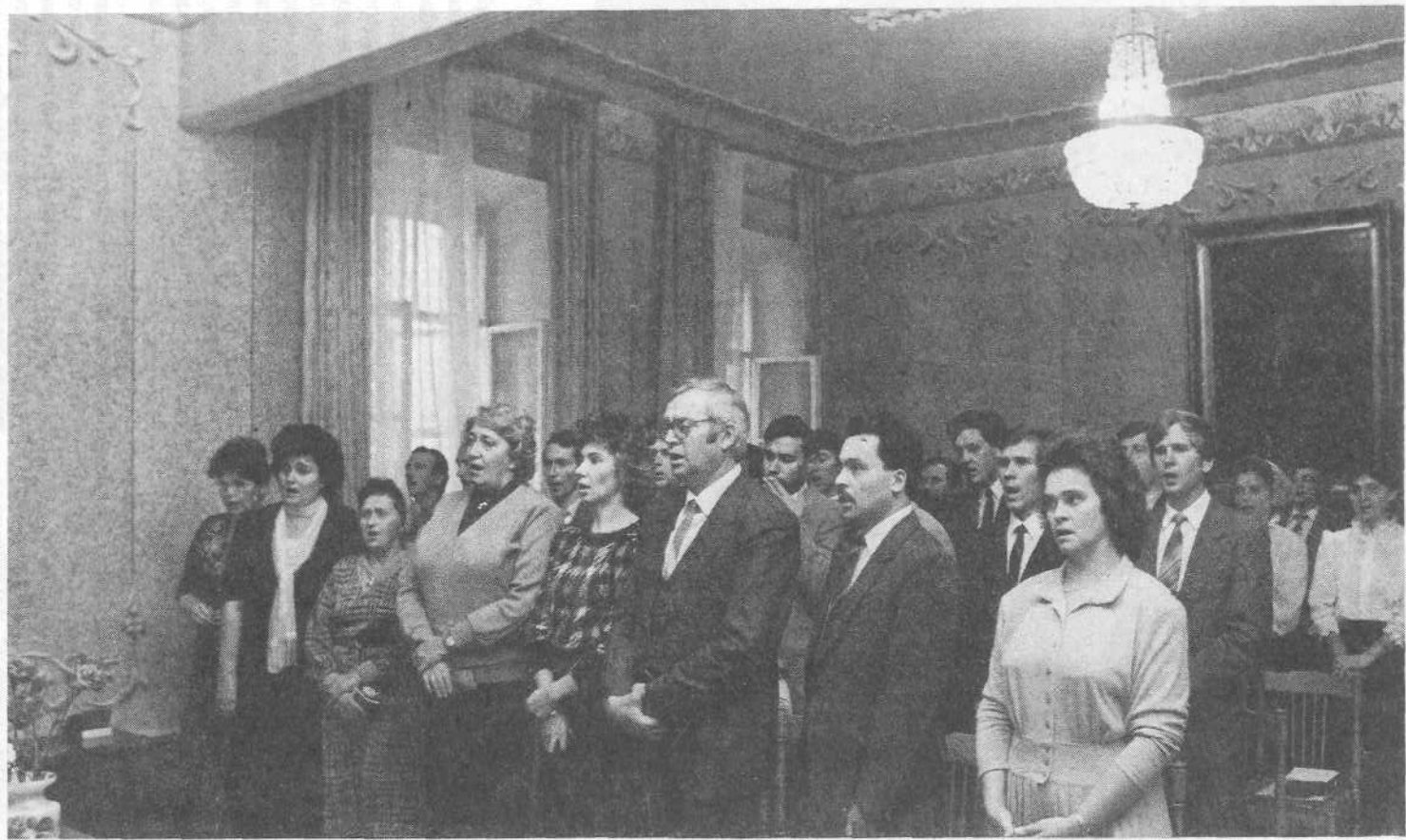
Преподаватели и выпускники регентского отделения заочных Библейских курсов.