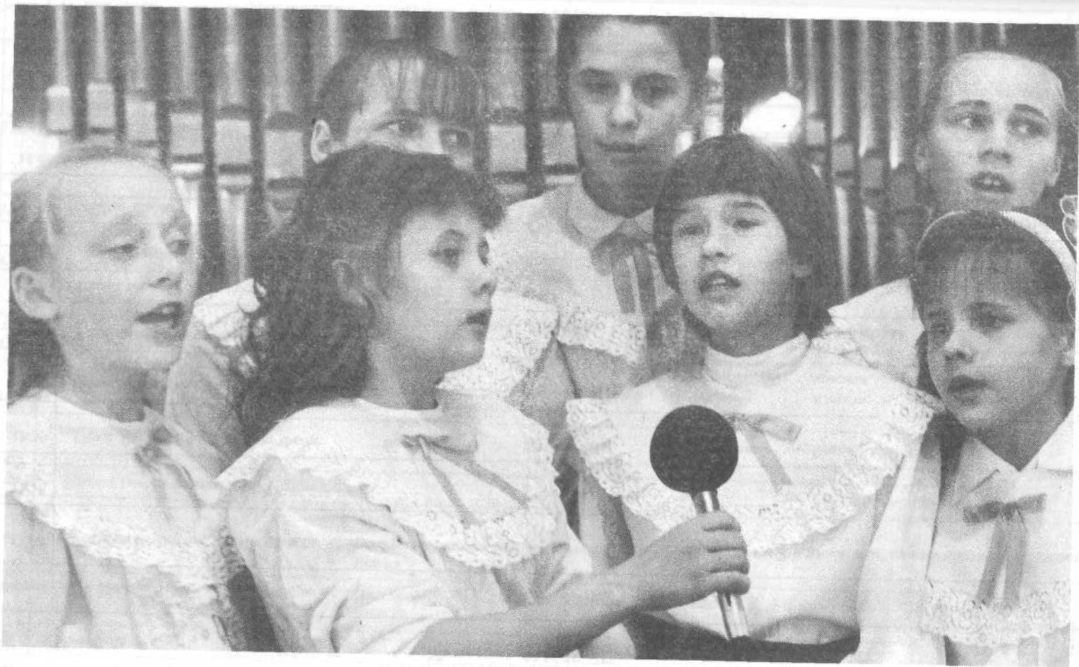
Пение детей на общине в Московской церкви.