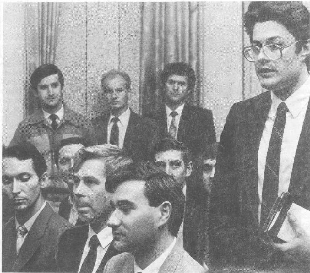
Выпускники регентского отделения ЗБК выступают со словом благодарности в адрес преподавателей.

теперь курсы имеют и методическую и теоретическую базы.