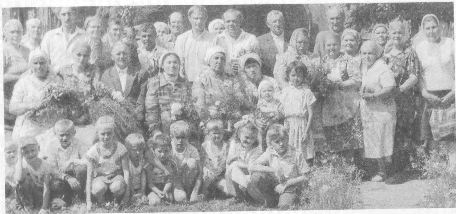
Новые члены церкви города Назарово.