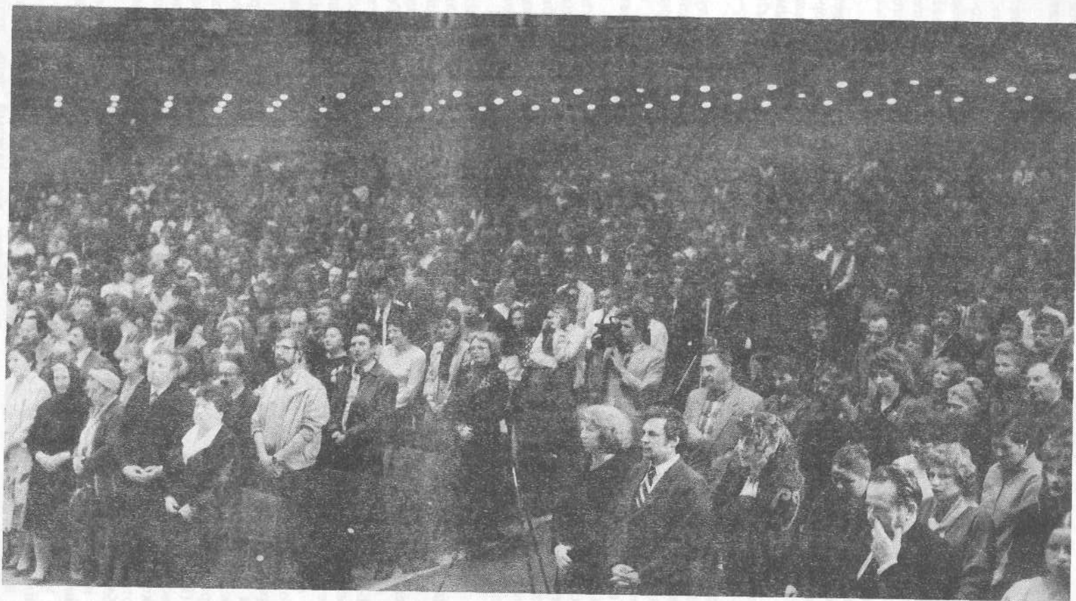
Евангелизационное собрание в городе Москве.