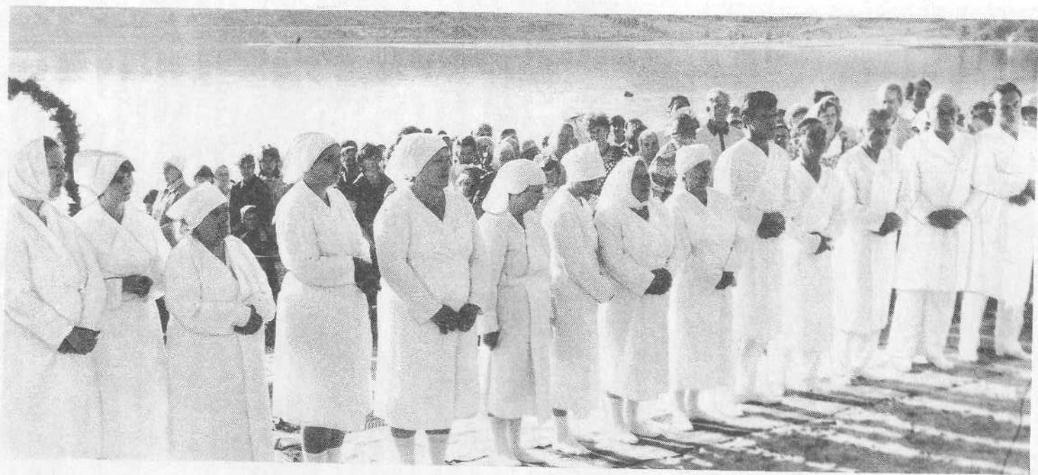
Крещаемые первой церкви города Алма-Ата.