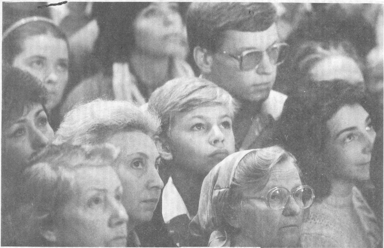
Покаявшиеся на евангелизационном собрании.