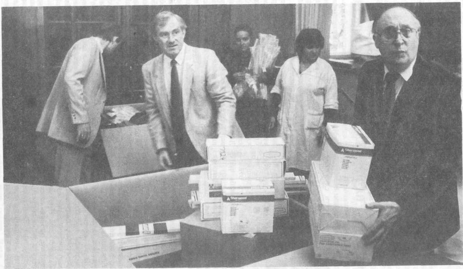
Получение медицинской аппаратуры от Международного фонда слез.