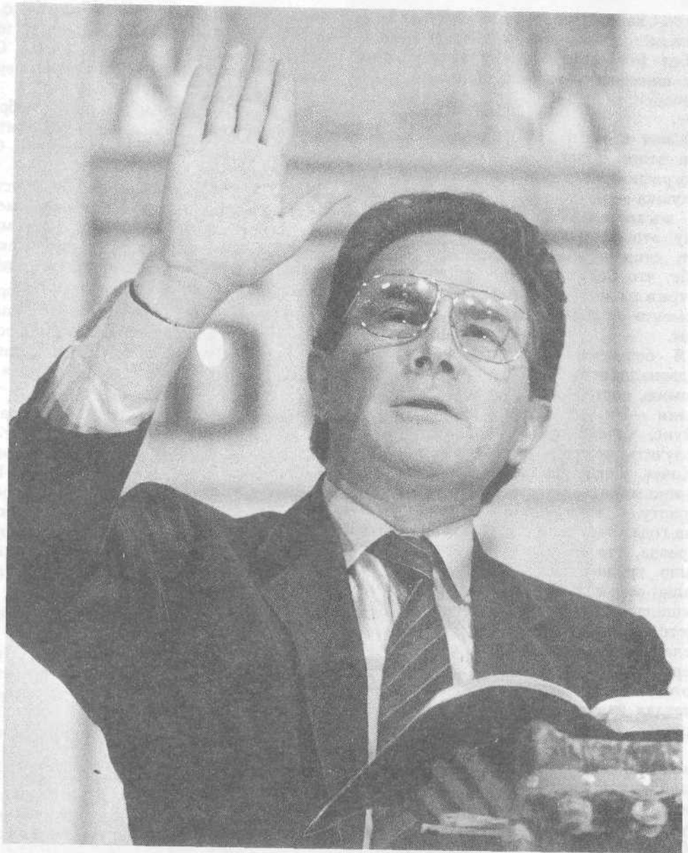
Доктор Луис Палау проповедует на богослужении церкви города Москвы.

щее в нем зло. Он есть вечный всемогущий Бог. И сила Его влияния на мир превосходит силу всех самых влиятельных людей прошлого и настоящего.