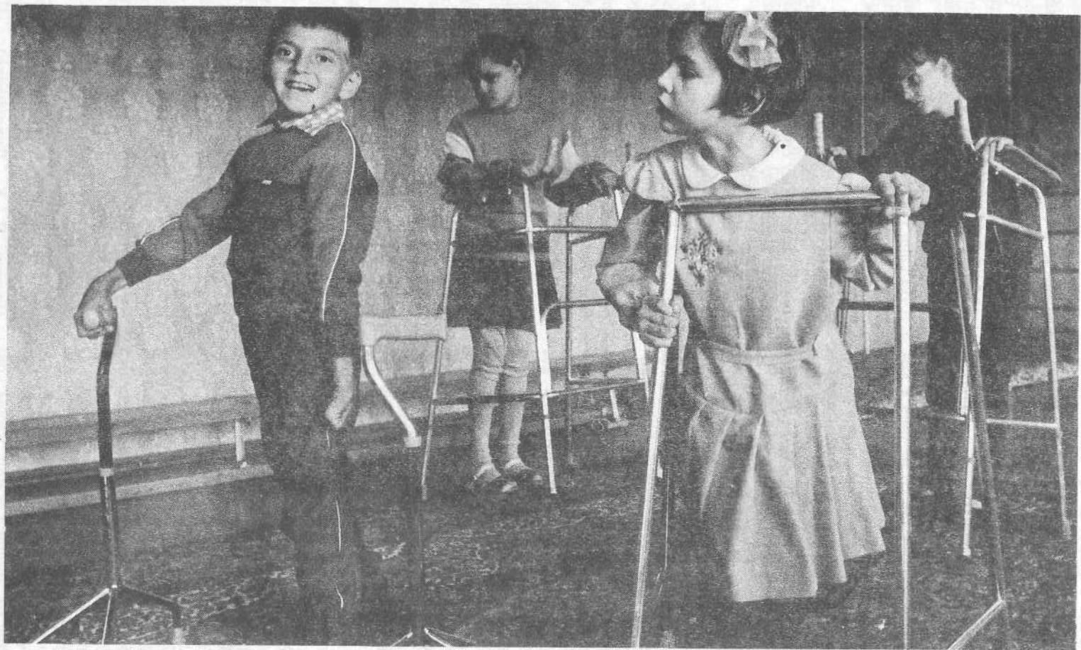
Дети, страдающие церебральным параличом (интернат № 28), опробуют приспособления, полученные от Международного фонда слез.