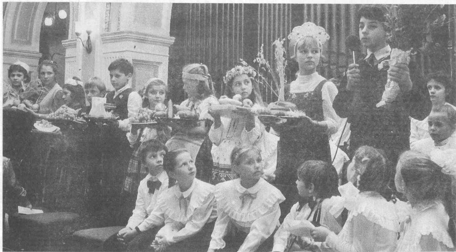
Детское общине в день Жатвы в Москве.