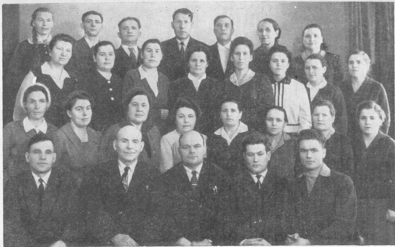
Барнаулский хор евангельских христиан-баптистов