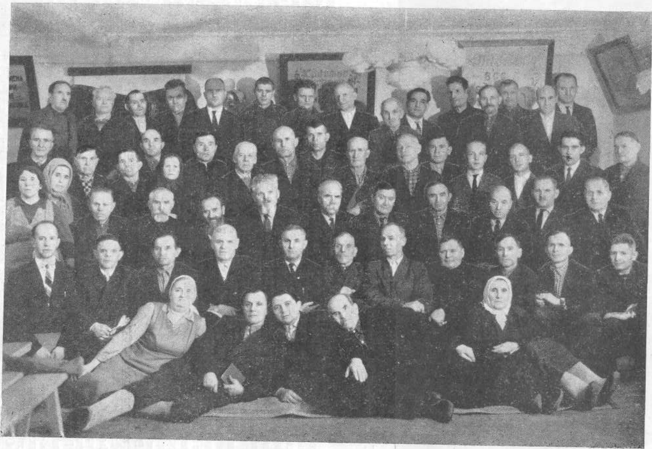
Участники совещания пресвитеров и других служителей церкви Курской области