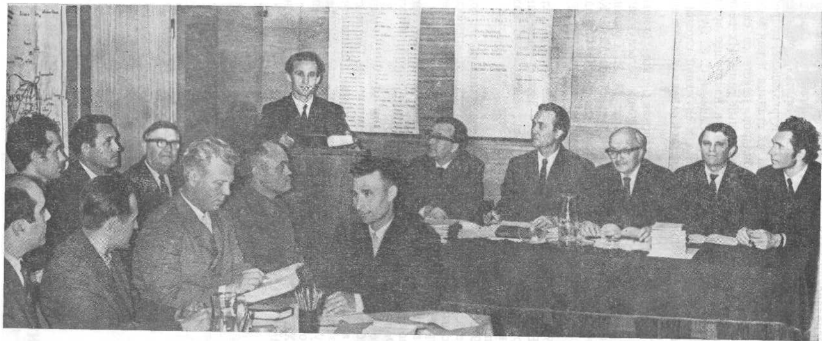
Сдача экзаменов на заочных Библейских курсах 1972 г.