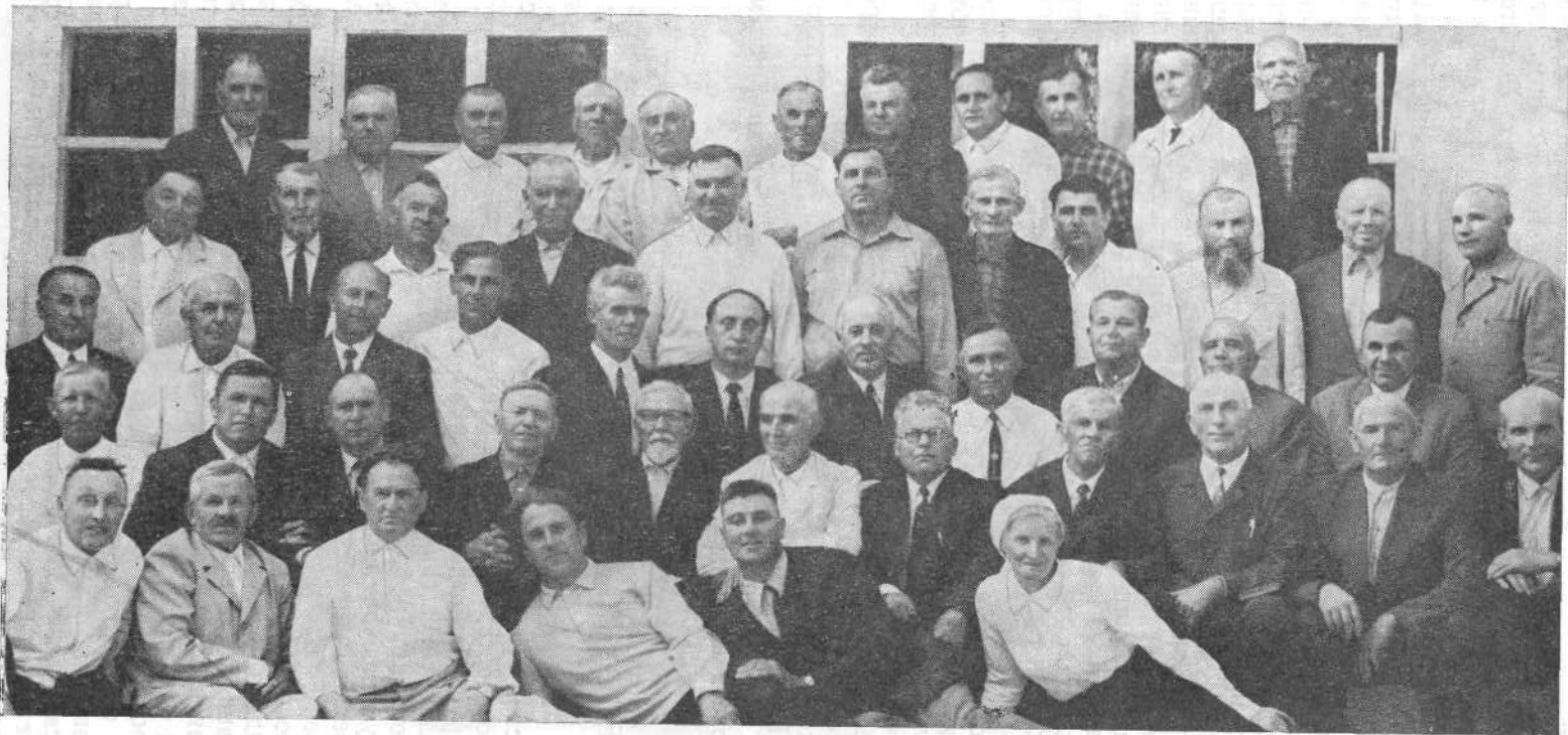
Участники пресвитерского совещания Ставропольского края