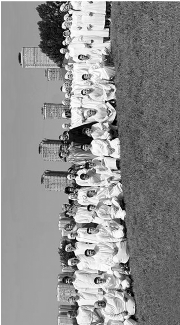
Крещаемые на Москва-реке